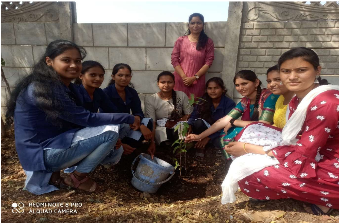
Tree plantation after Students collecting garbage