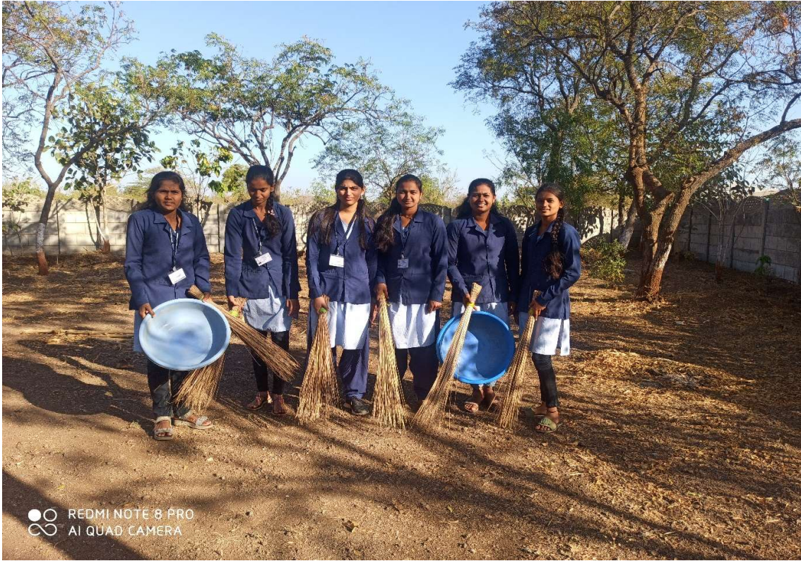
Mission of dust free campus Students of earn and learn