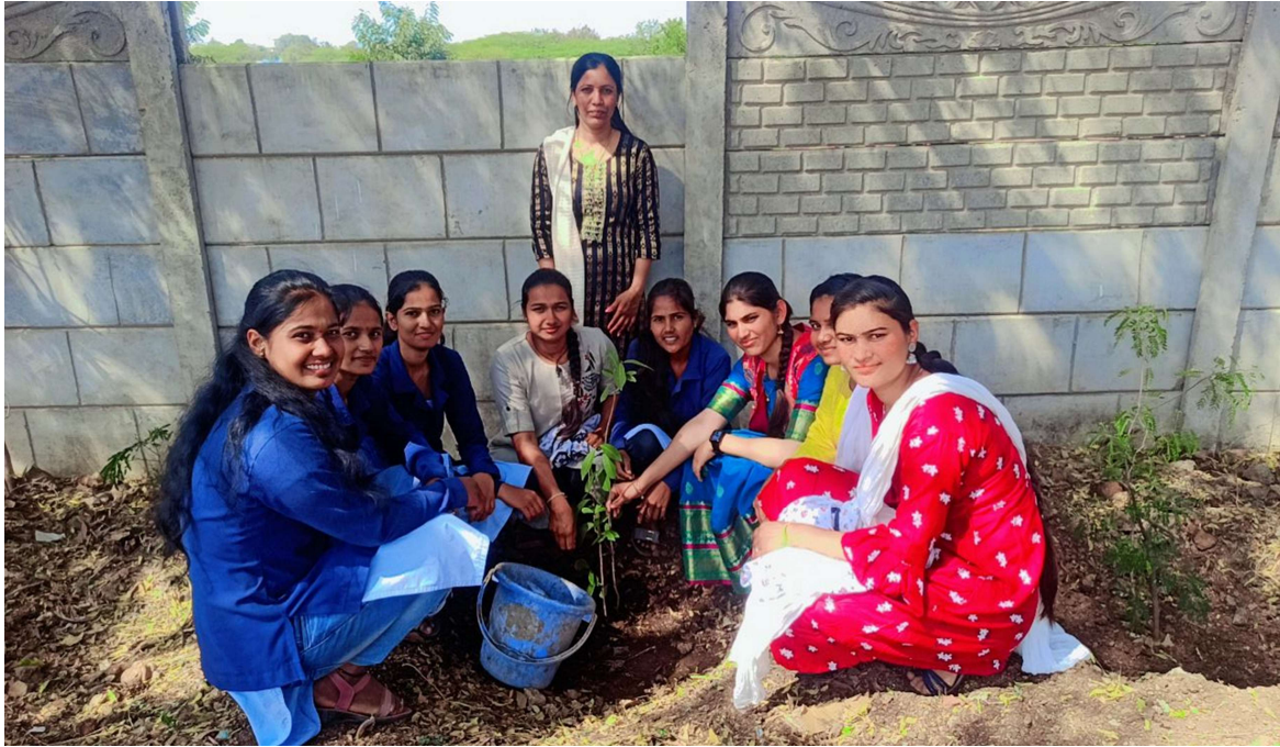
Water supply to tree planting by student