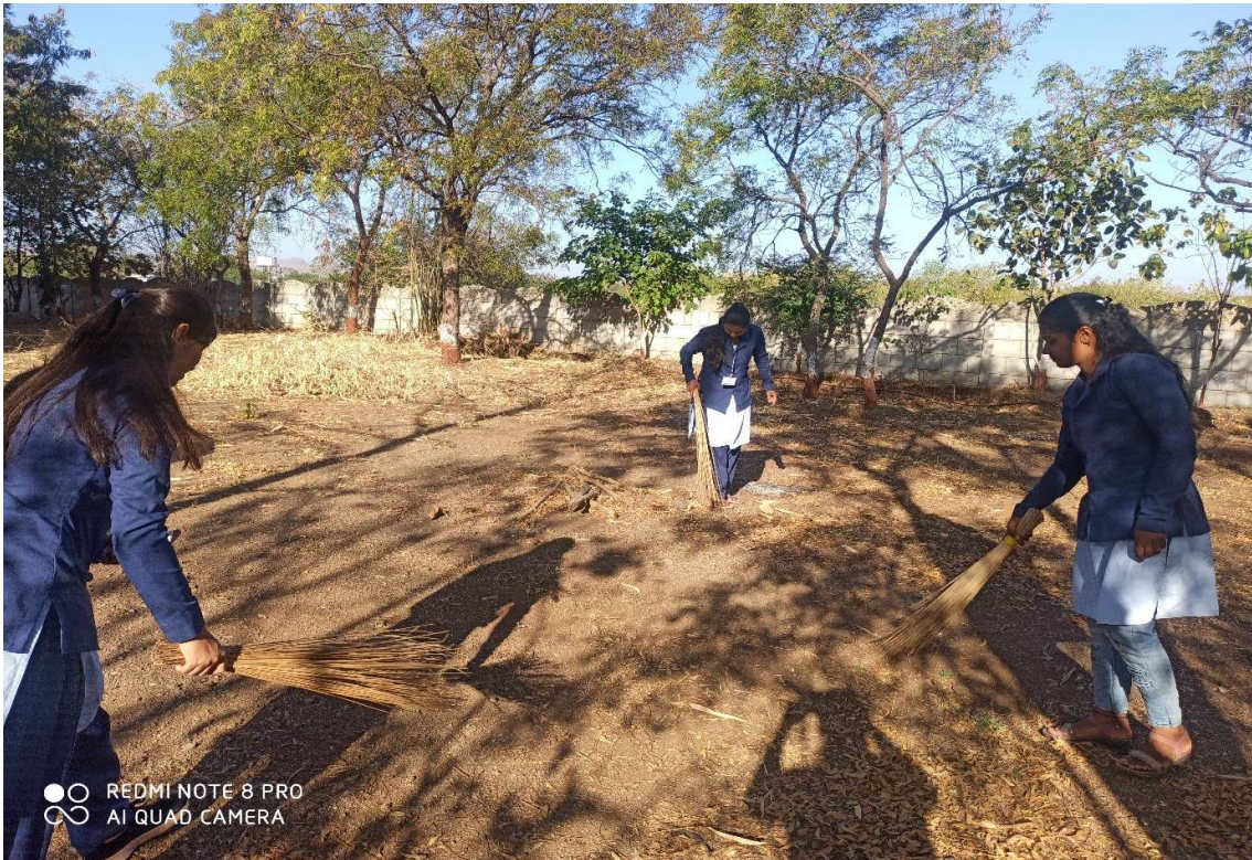
Students collecting garbage