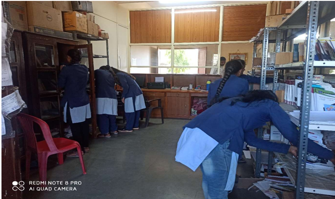
Students of earn and learn arranging books and cleaning the library