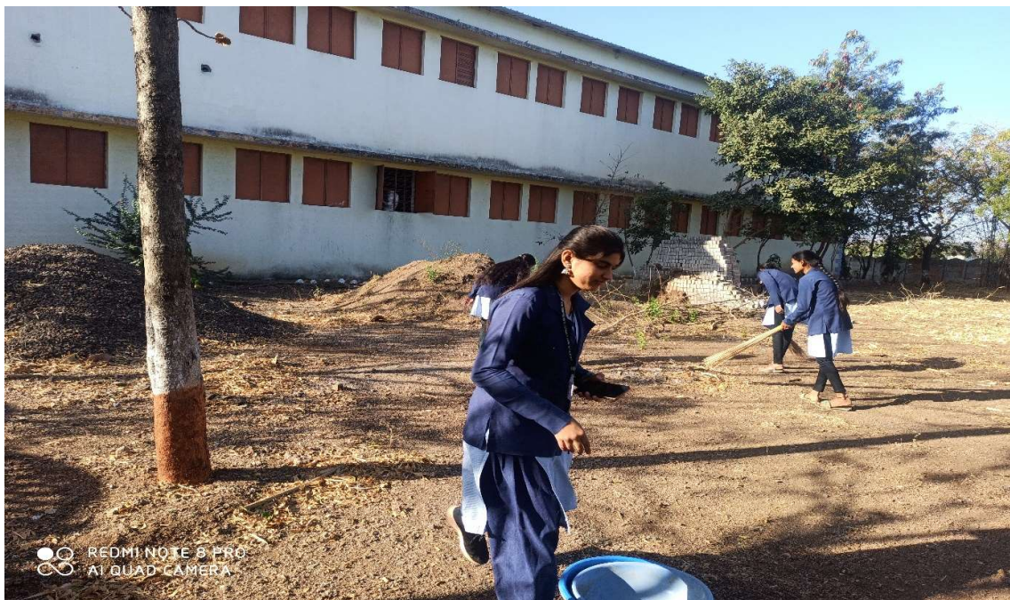
College Back area cleaning by students