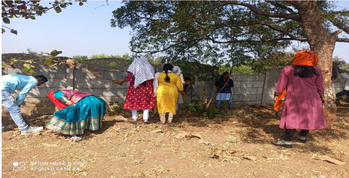
Students cleaning the tree fence