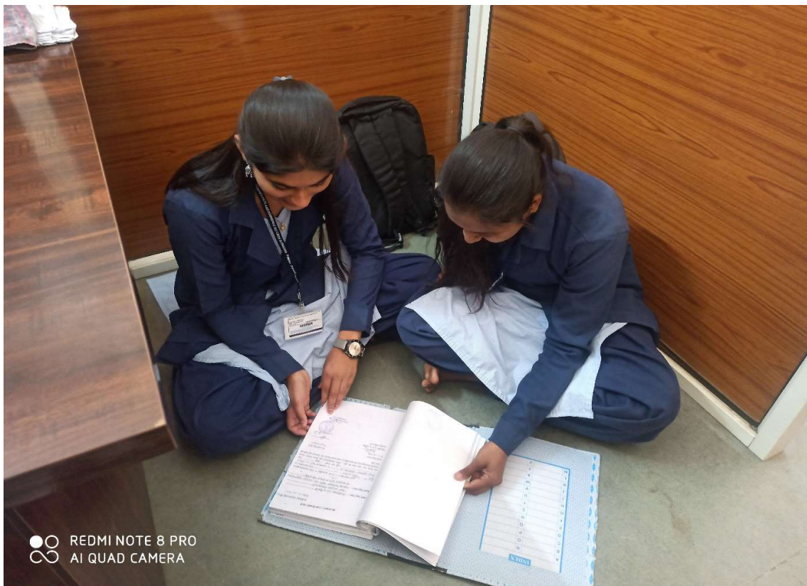
Departmental work by students