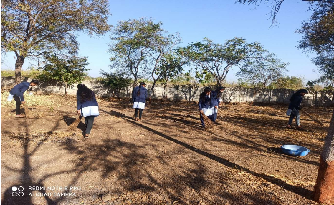
College campus cleaning by Students of earn and learn