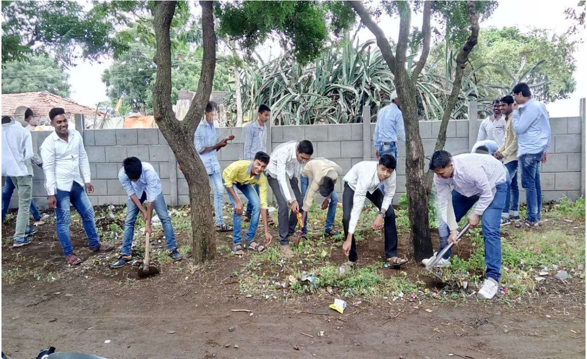
College students participation in activity