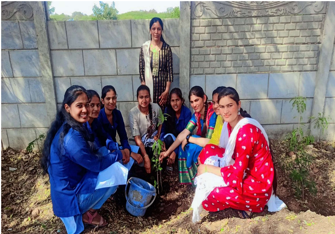
Tree plantation in campus from students