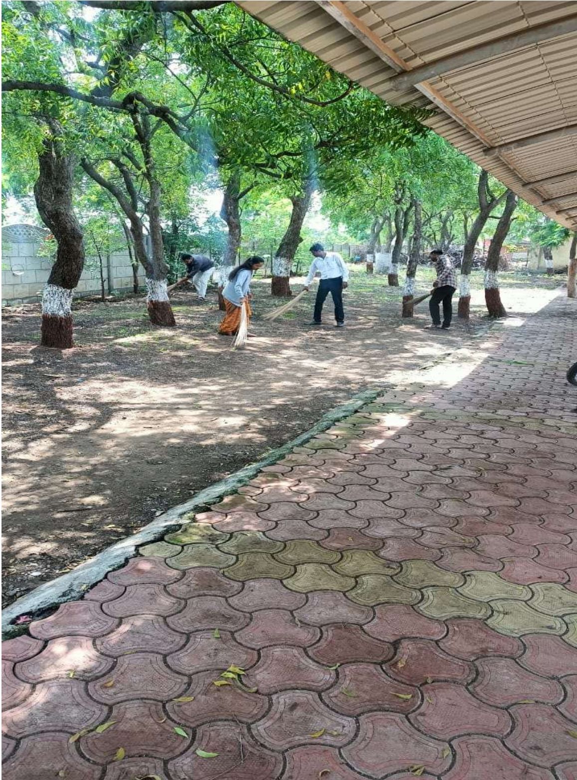
College staff cleaning the college campus