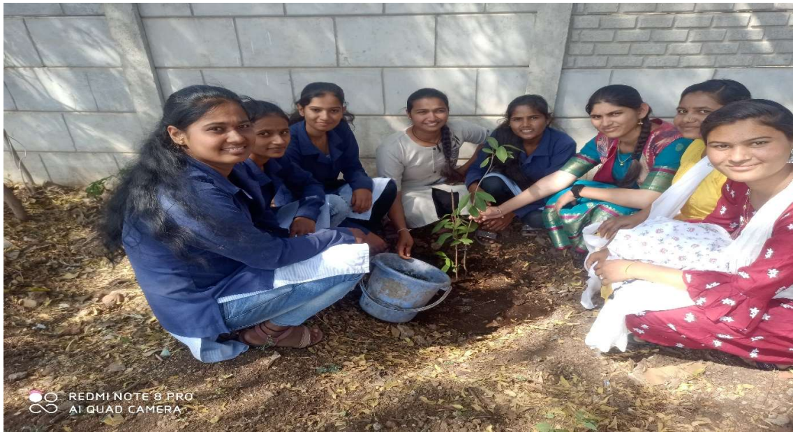
Water supply to tree