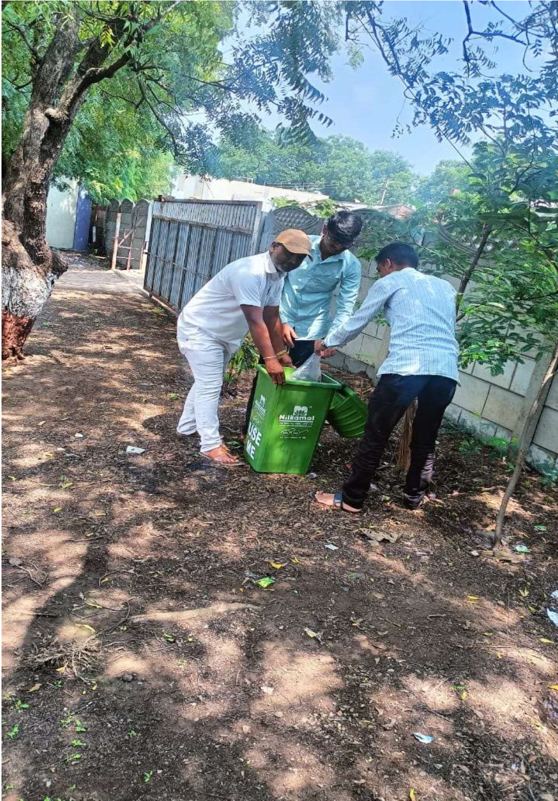
Use dustbin for campus cleaning (plastic free campus )