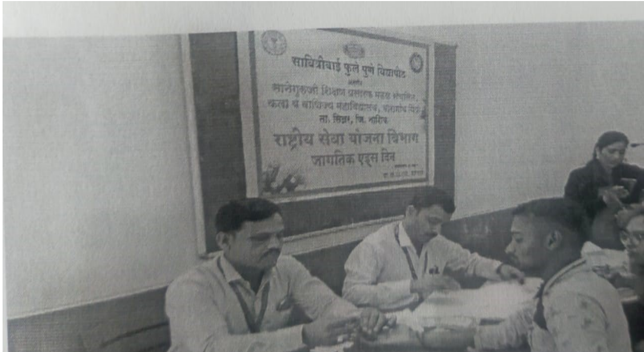
Student During the blood test in the program