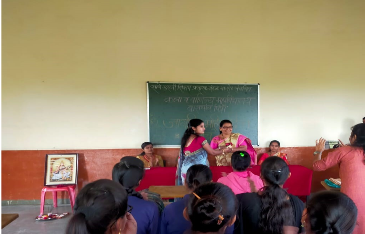
Asst. Prof. nannaware mam felicitated to chief guest shaik mam