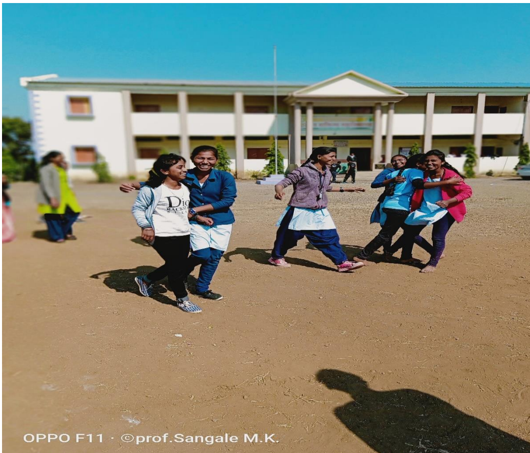
GIRLS ARE EXPOSING HAPPINESS AFTER WIN THE CRICKET MATCH