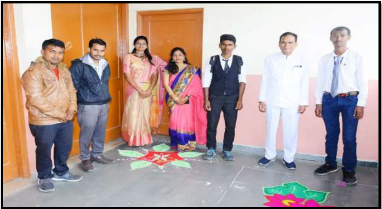
Rangoli Competetion Supervision on the Youth Festival