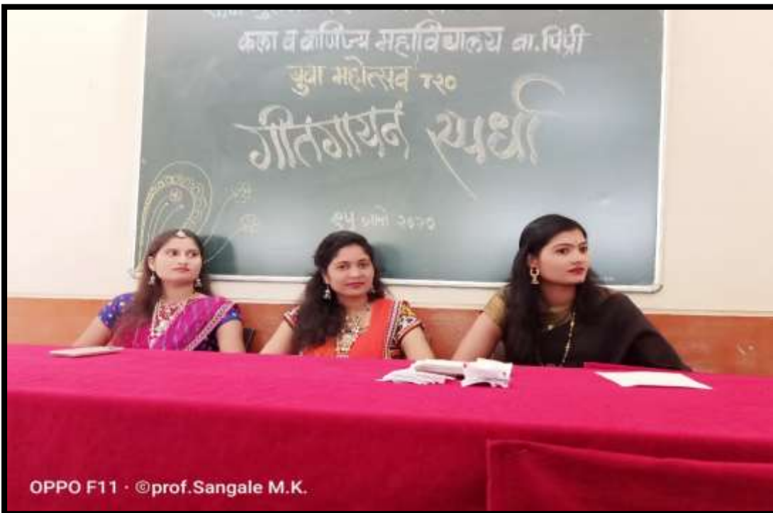
Singing Competetion Event on Youth Festival