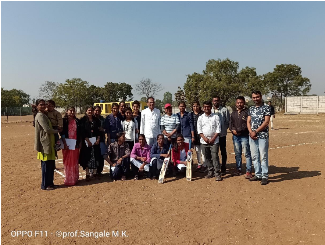
GIRLS ARE PLAYING CRICKET