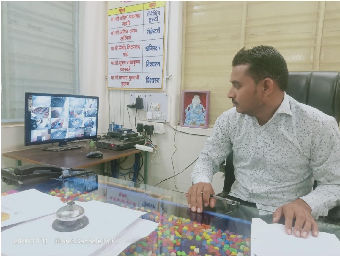
CCTV CONNECTION IN PRINCIPAL CABIN