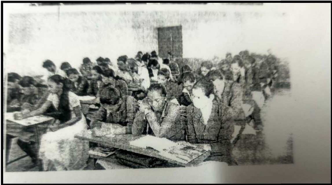
Student Reading Books, Newspaper, Novels Etc.