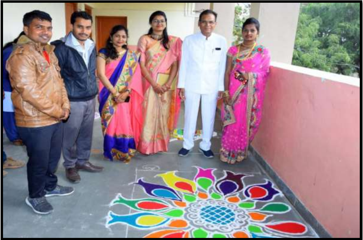
Rangoli Competition Observation by Principal & Asst. Professors