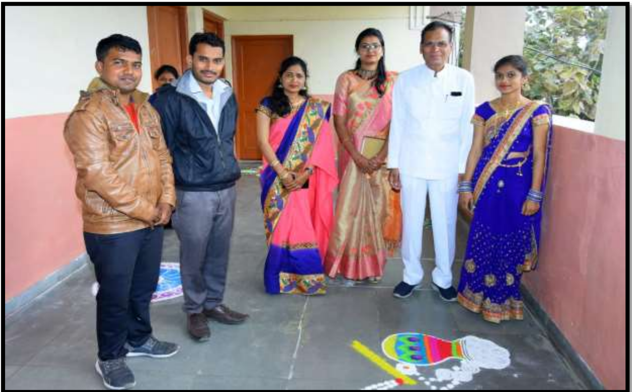
Rangoli Competition on Youth Festival