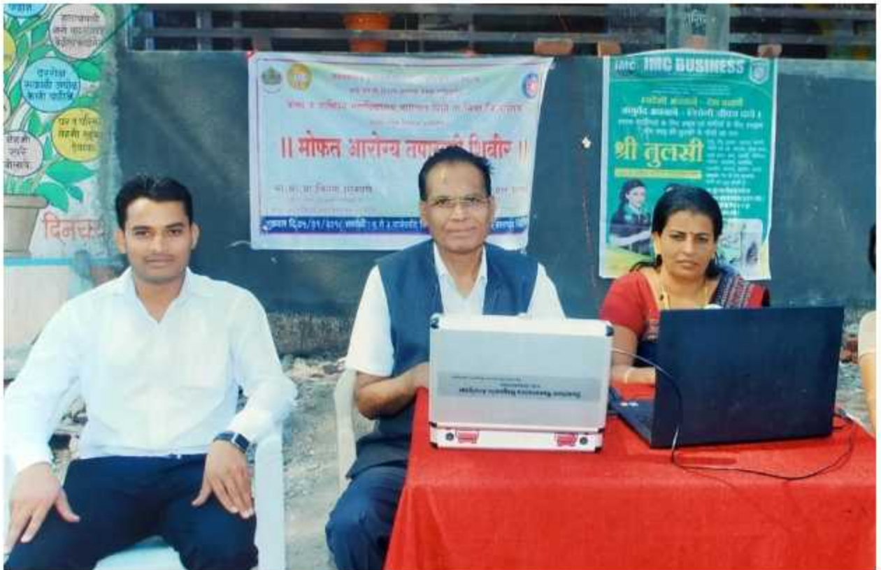
Principal & staff @ on work