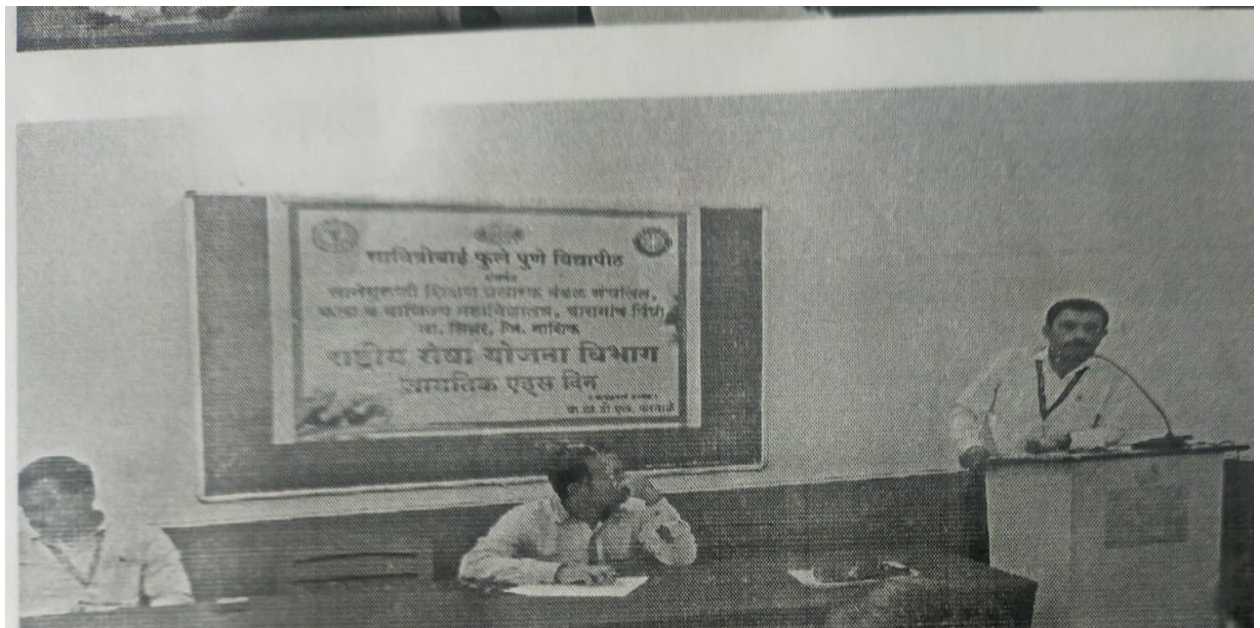
Mr. bodke sir informing to students about AIDS