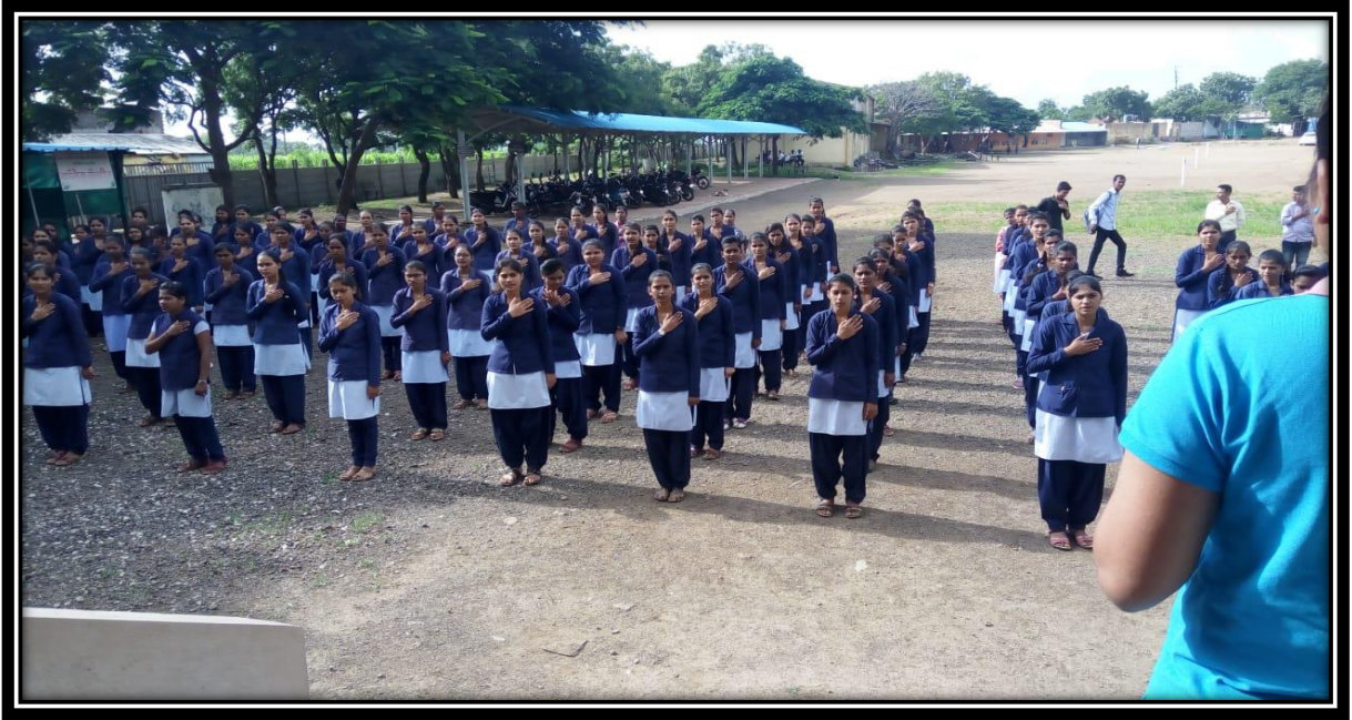
Student Performing On International Sport Day