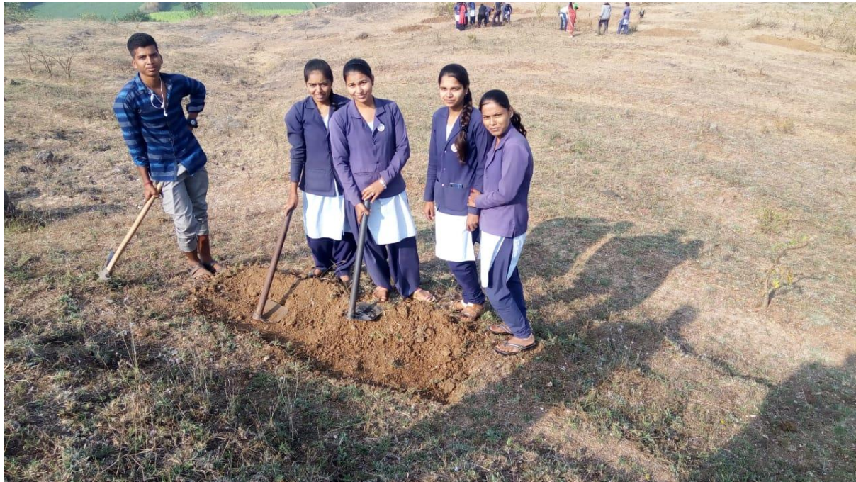
GIRLS ARE WORKING IN NSS CAMP