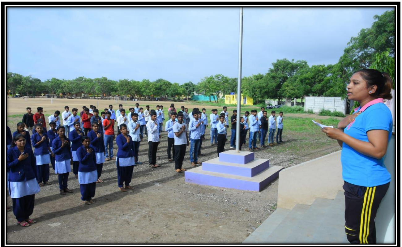
Student Performing Yoga on Fit India Movement