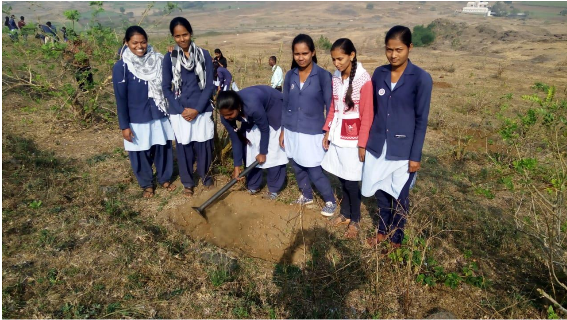
GIRLS ARE WORKING IN NSS CAMP