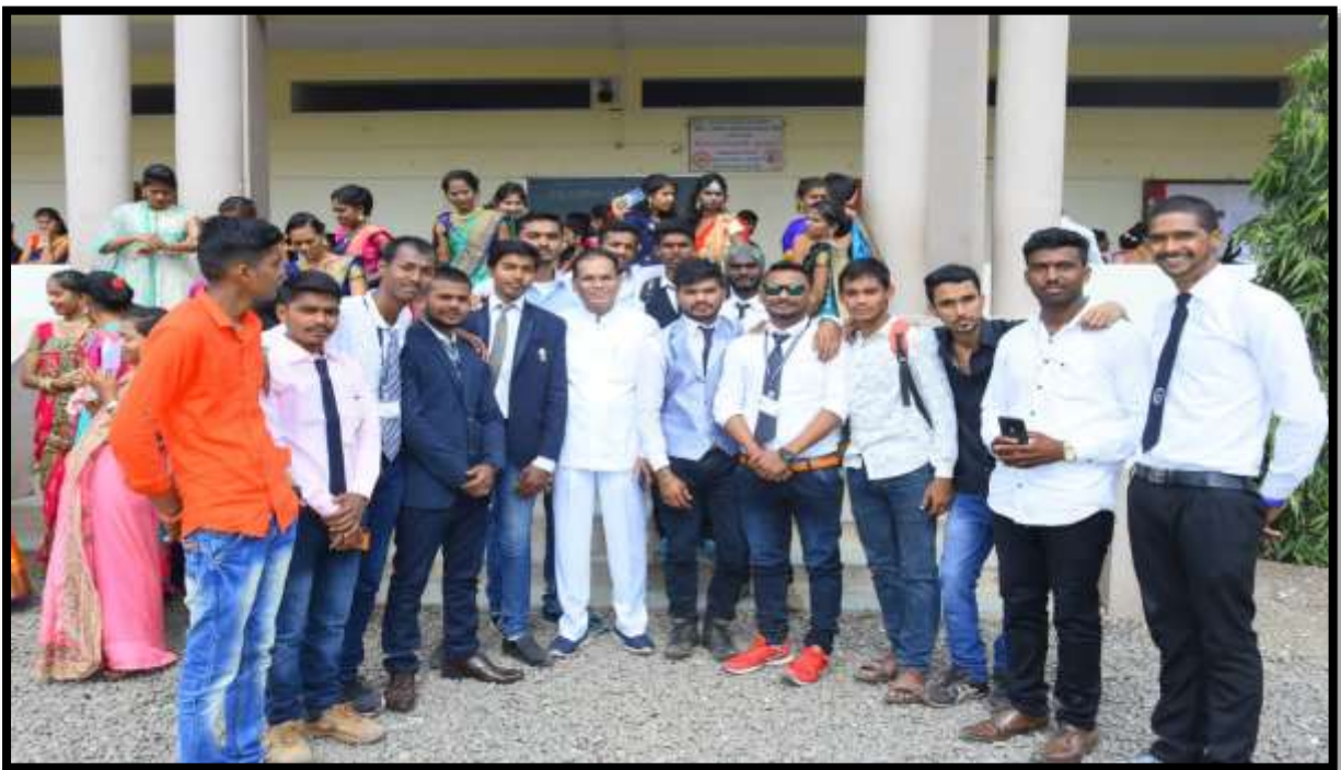
Principal with student on Tie Day