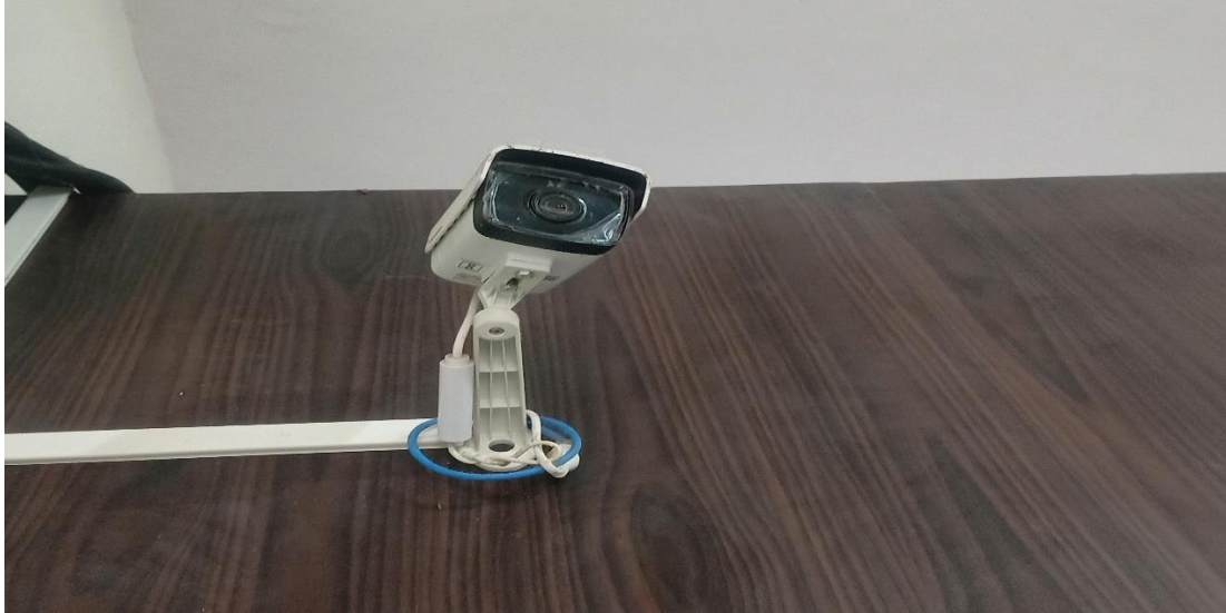
CCTV CAMERA IN COLLEGE CAMPUS