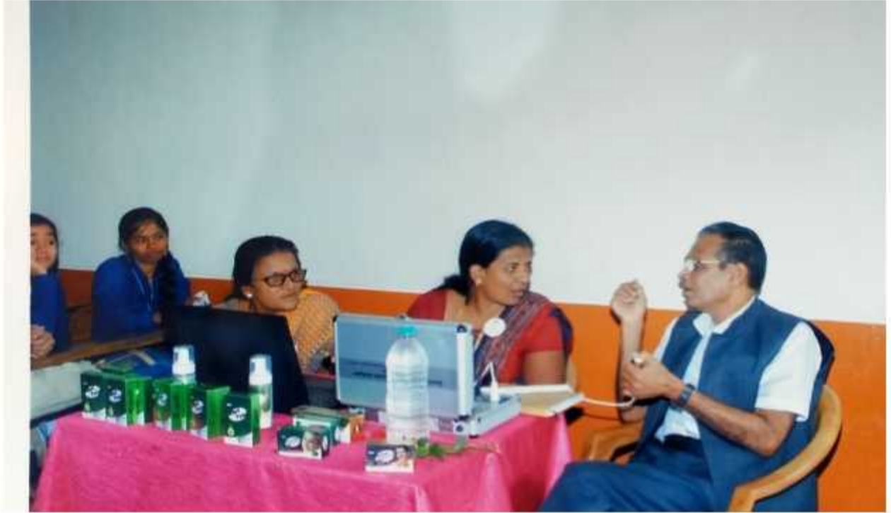
Principal D.L. phartale communicate to staff