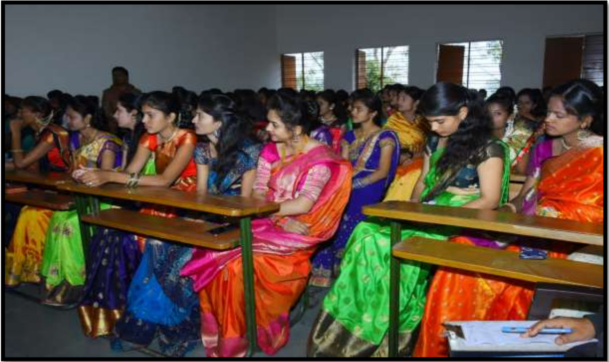
Student Attend the programme on Youth Festival