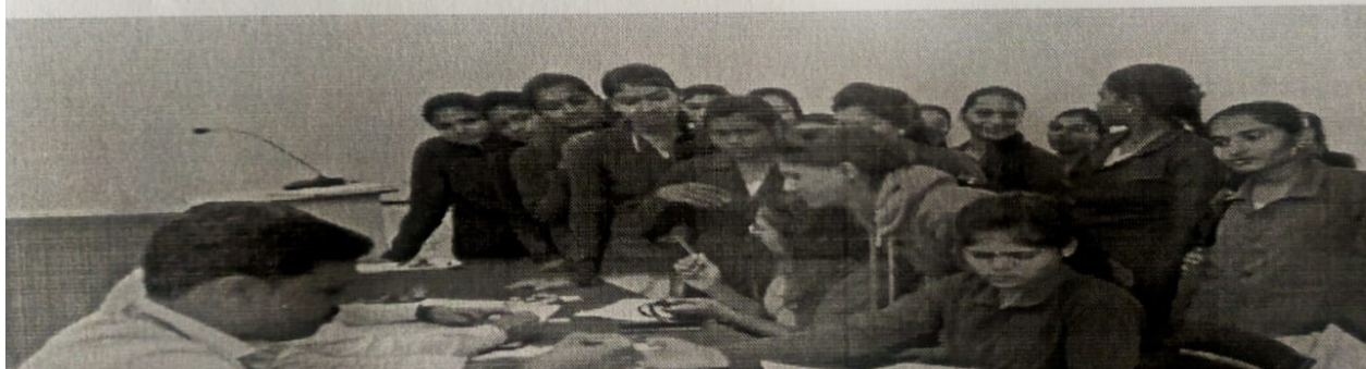
Student curiosity the blood test in the program