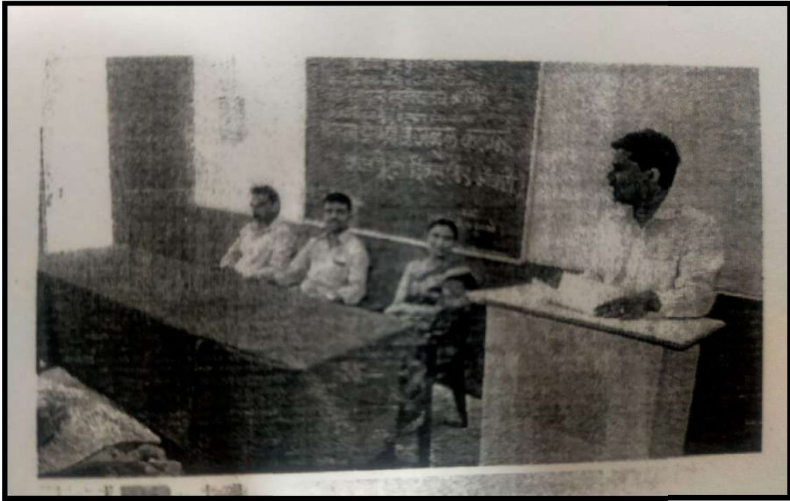
NSS Officer Give Information about Dr. Kalam Sir