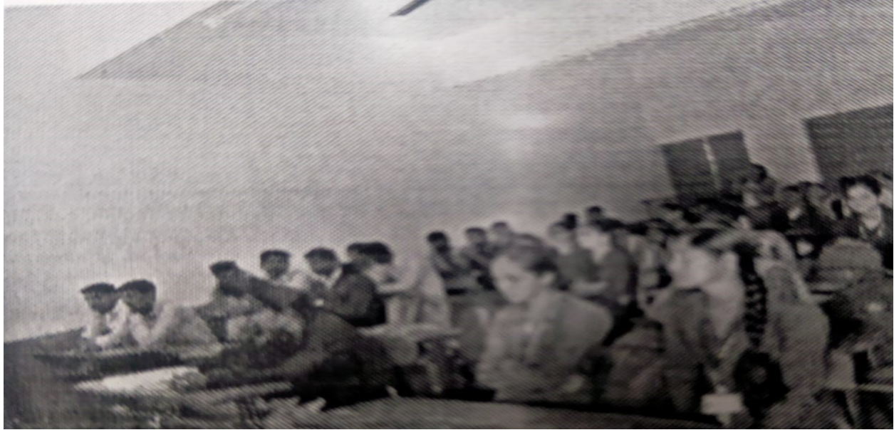
Students Present in national girl child day Program