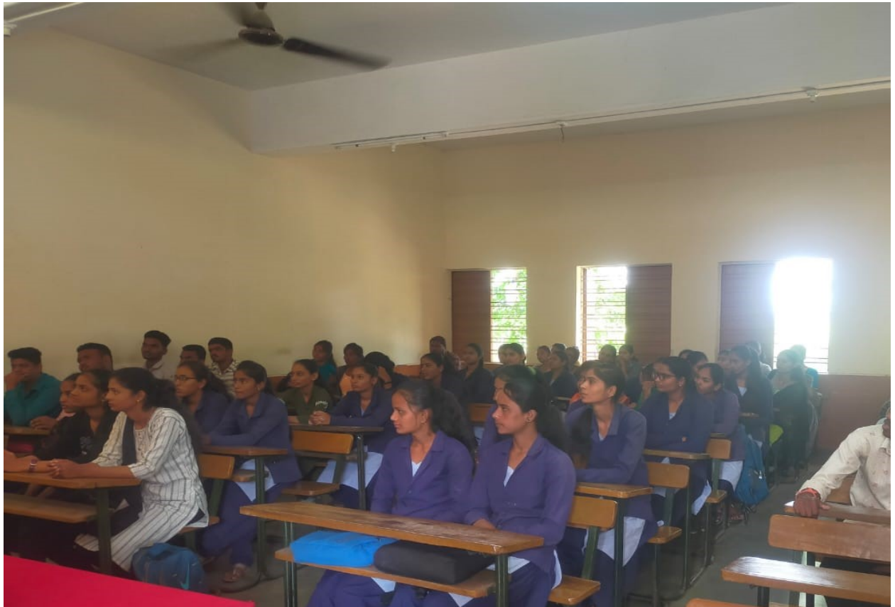
Students attendance the program