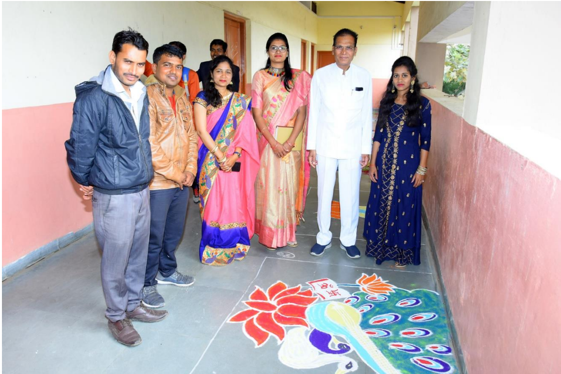
PRINCIPAL AND TEACHING STAFF WITH RANGOLI COMETETION WINNER