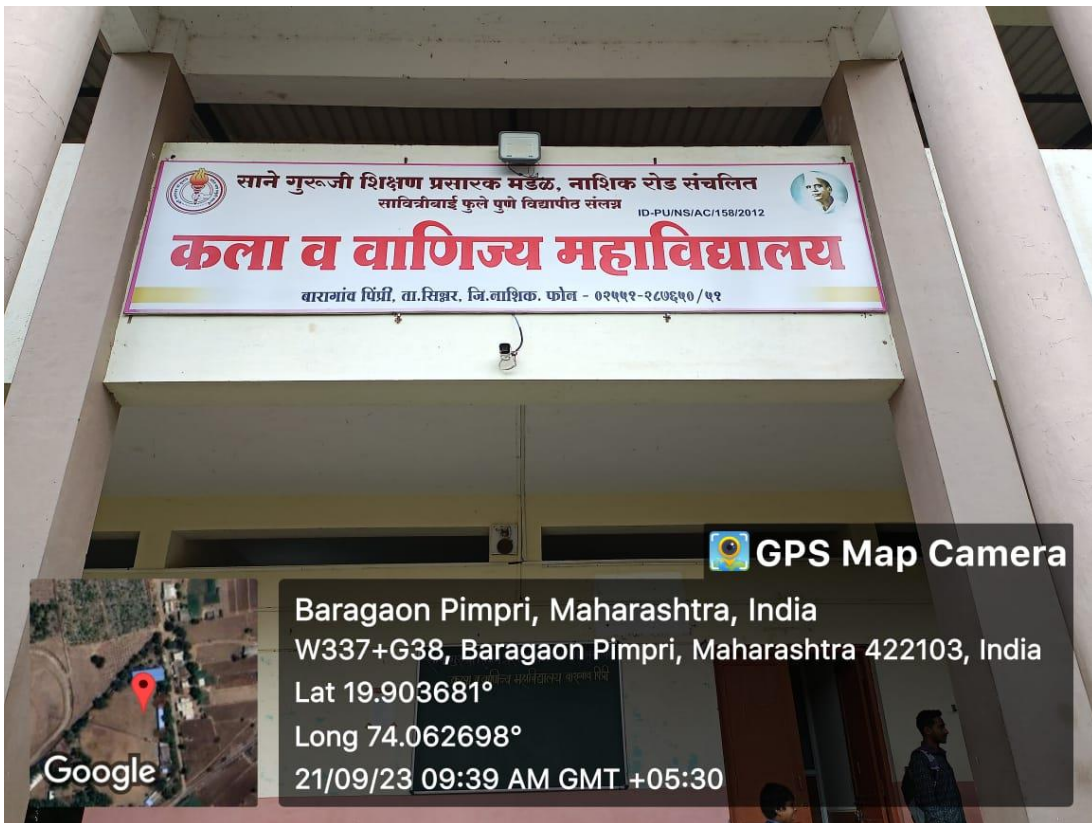
CCTV ON COLLEGE GATE