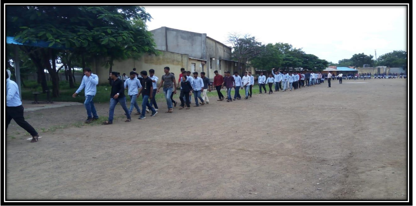
Student Participating in the Rally for Fit India Movement