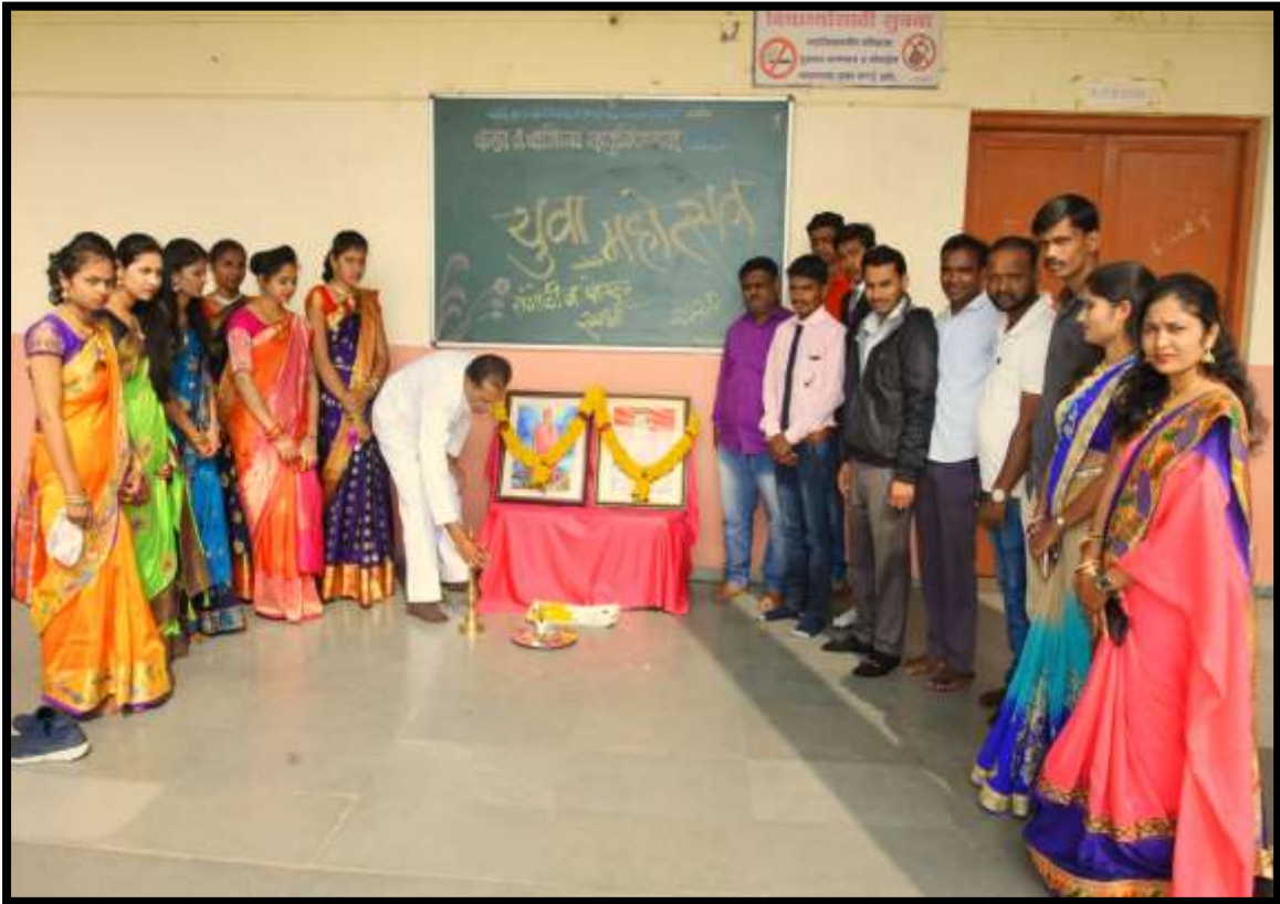
Honorable Principal Inaugrating The Youth Festival