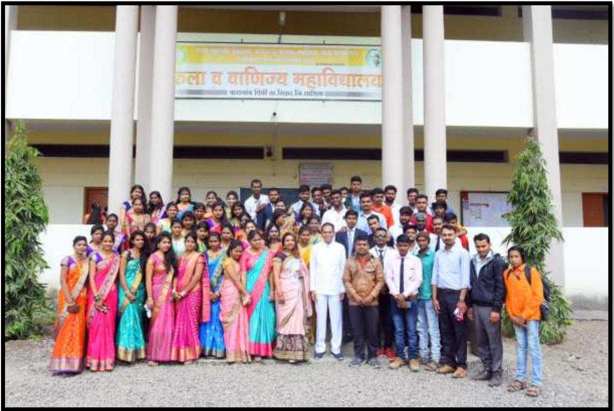
Sari Day & Tie Day on Youth Festival