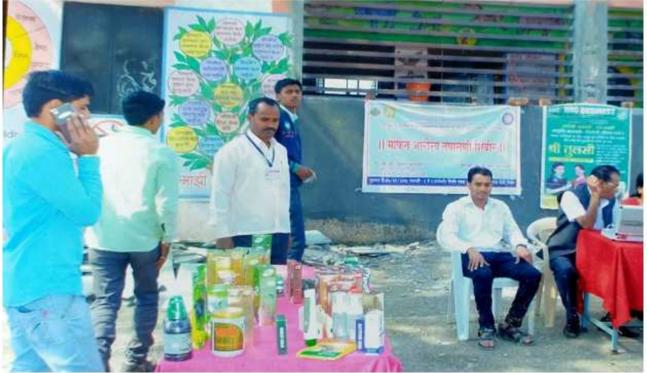
On field free health checkup camp