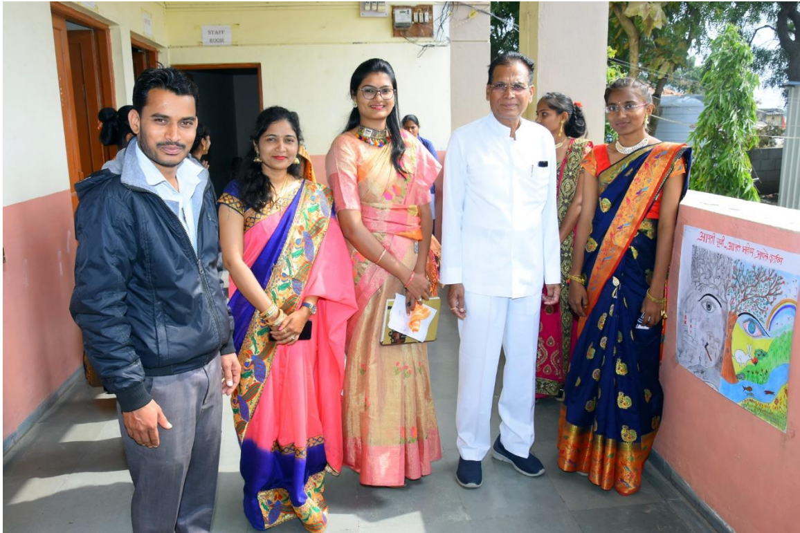
POSTER COMPETITION IN COLLEGE