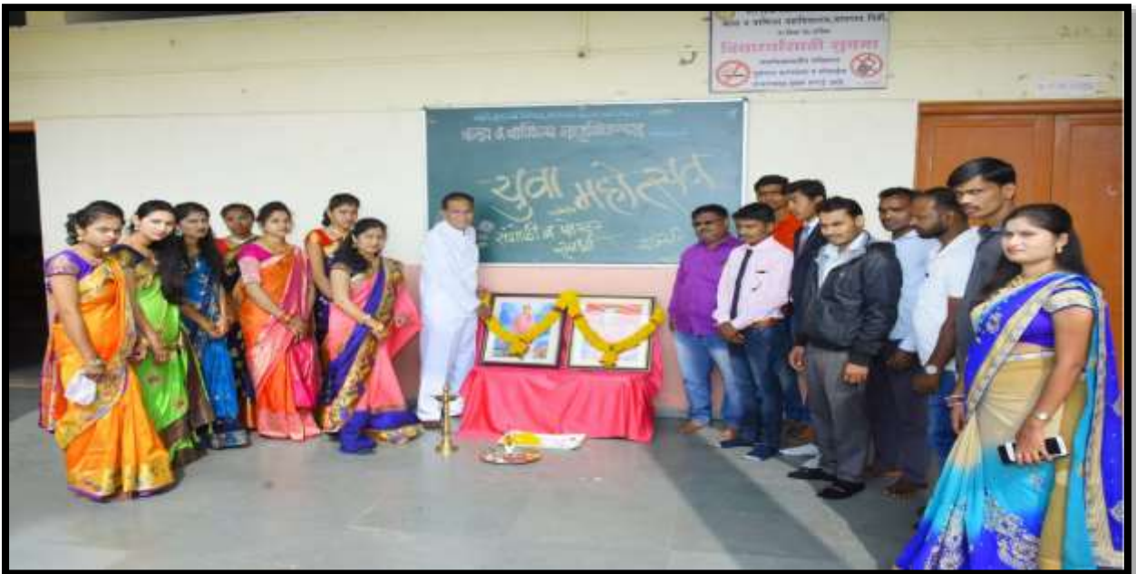
Principal , Teaching & Non-Teaching Staff on Youth festival