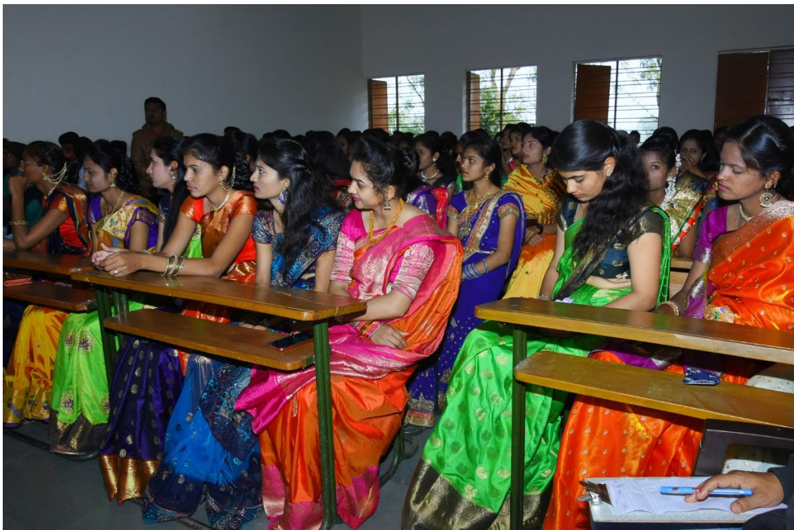
YOUTH WEEK FESTIVAL IN COLLEGE