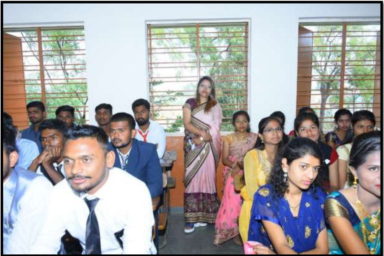
Student Attending Debate Competetion on Youth Festival