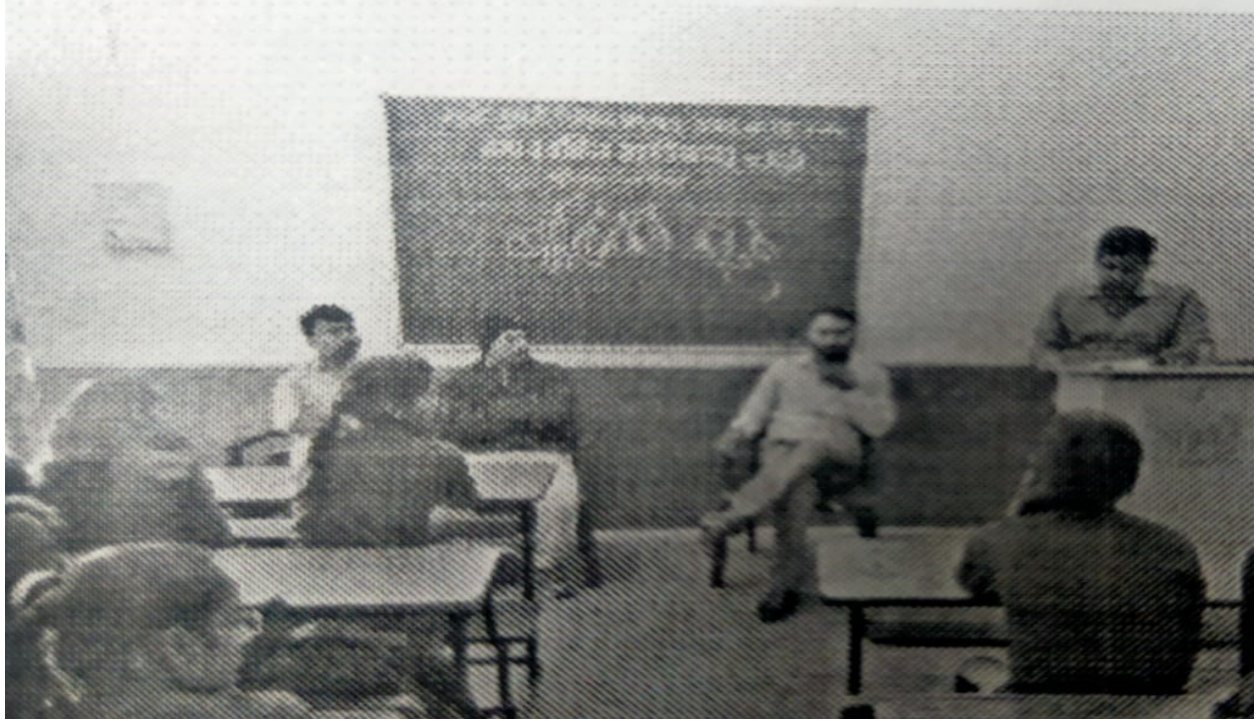
National Girl Child Day program