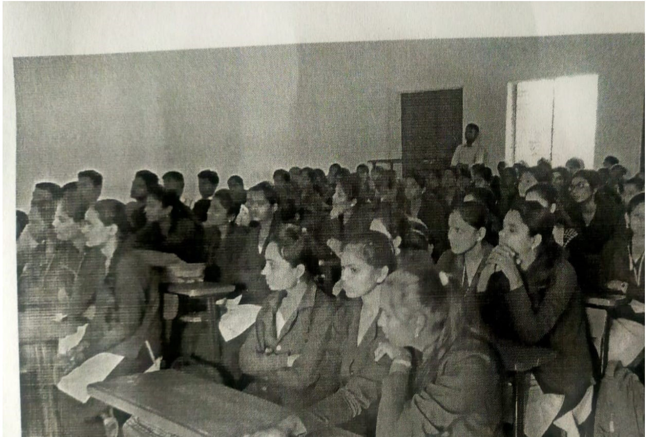
Students listening intently to information about AIDS