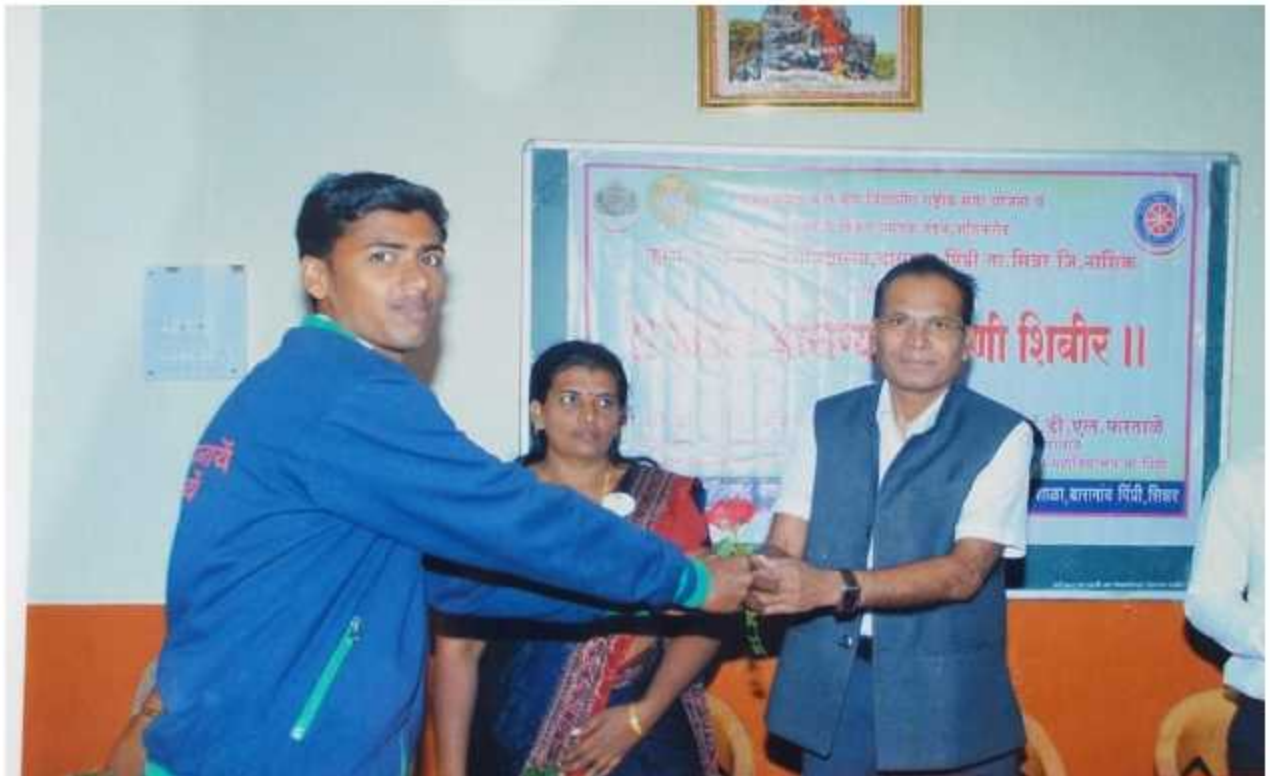
While felicitating the principal