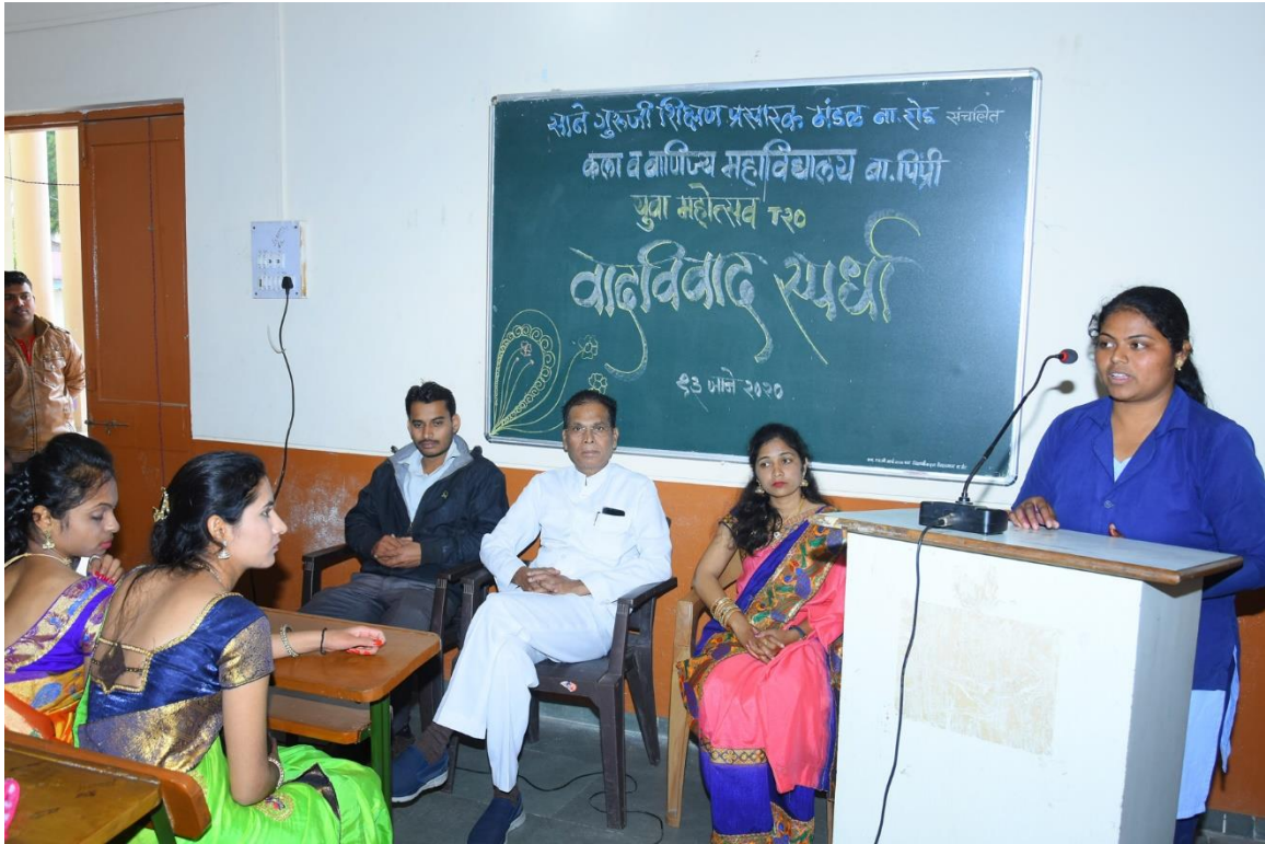
STUDENT PARTICIPATING IN DEBATING COMETETION