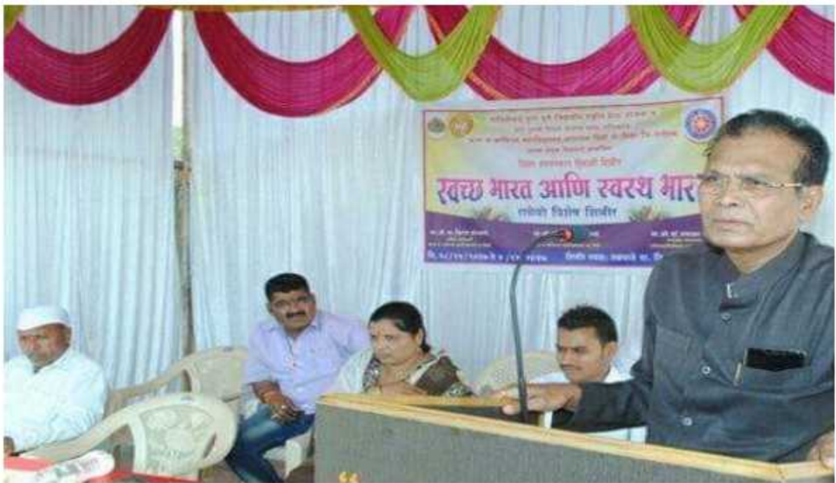
Principal addressing students