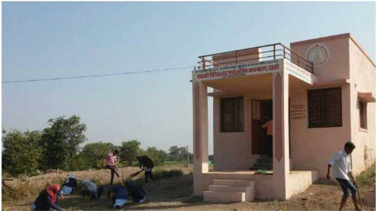
Student Cleaning the library of Talwade Village