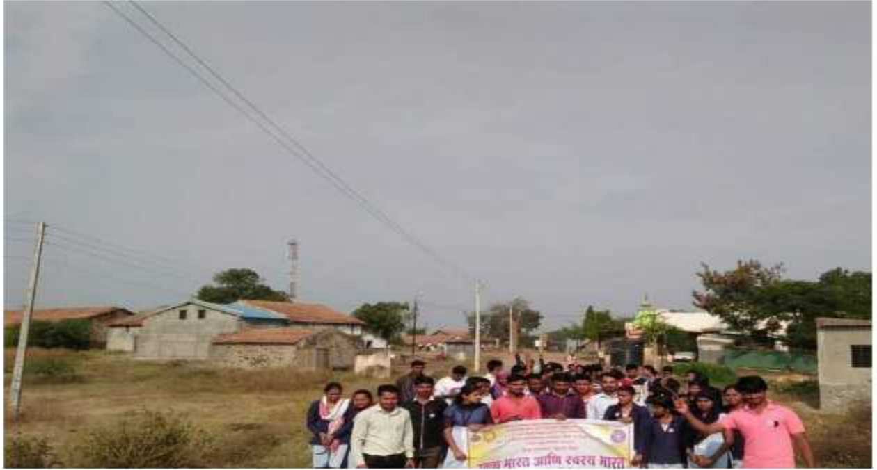
Swaccha Bharat Ani Swasth Bharat Morning Rally