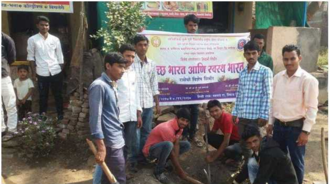
Students Create The Sinkhole in Talwade Village