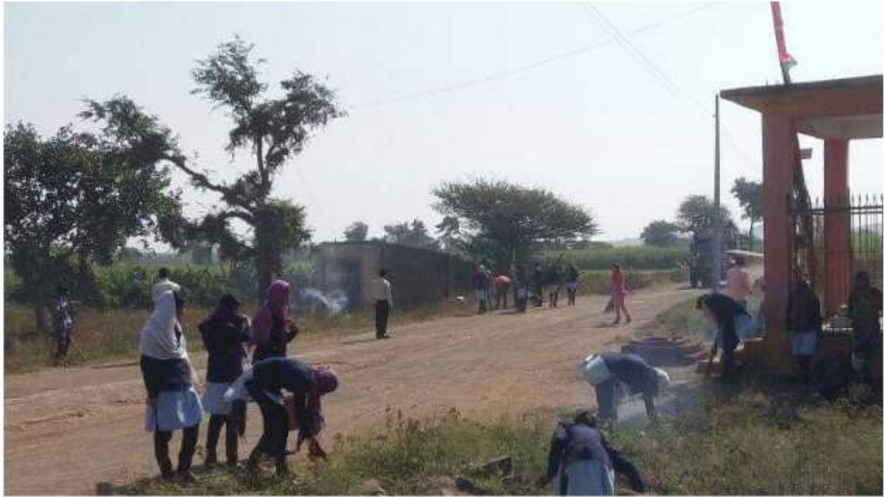
Student While Cleaning The Temple and Road Of Talwade Village