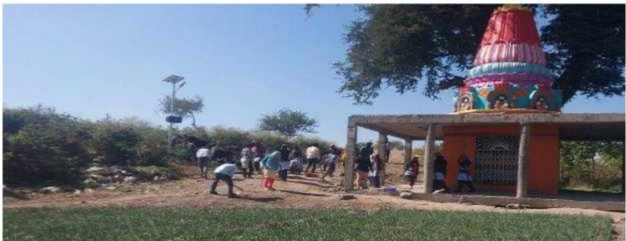
Student While Cleaning The another Temple Of Talwade Village