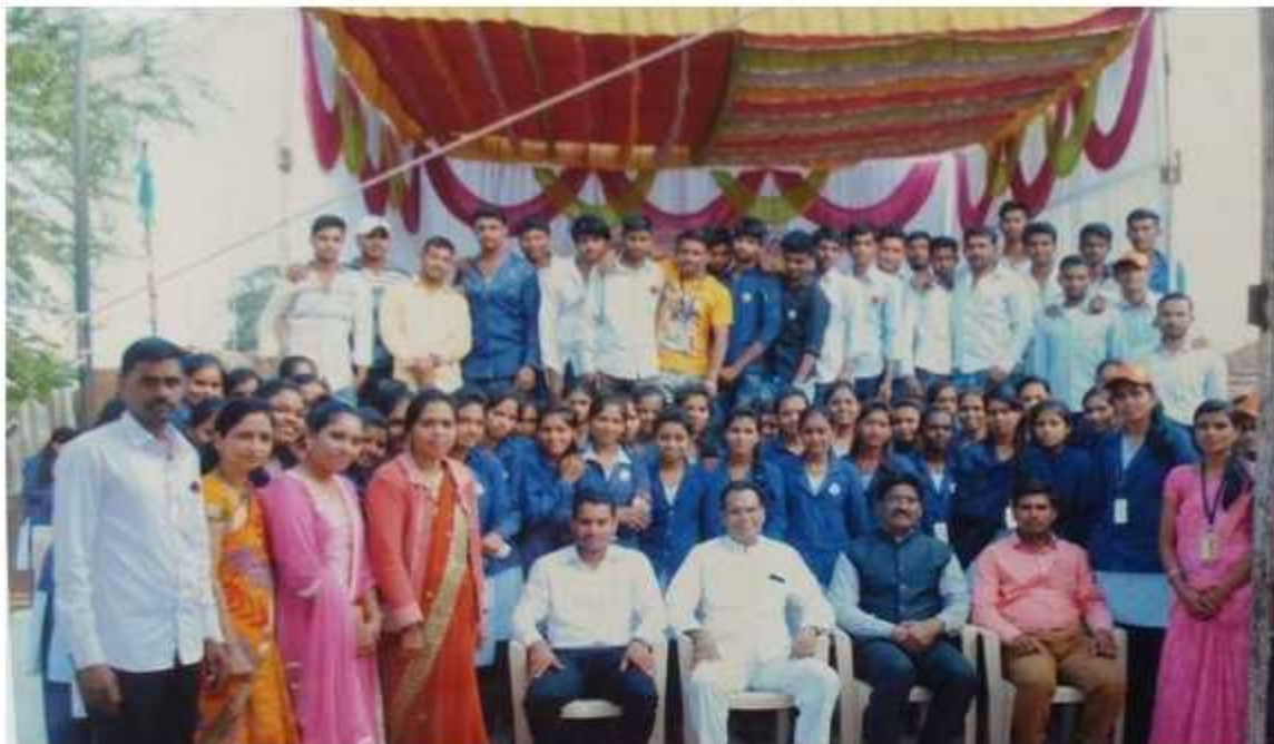
Closing Ceremony Photo