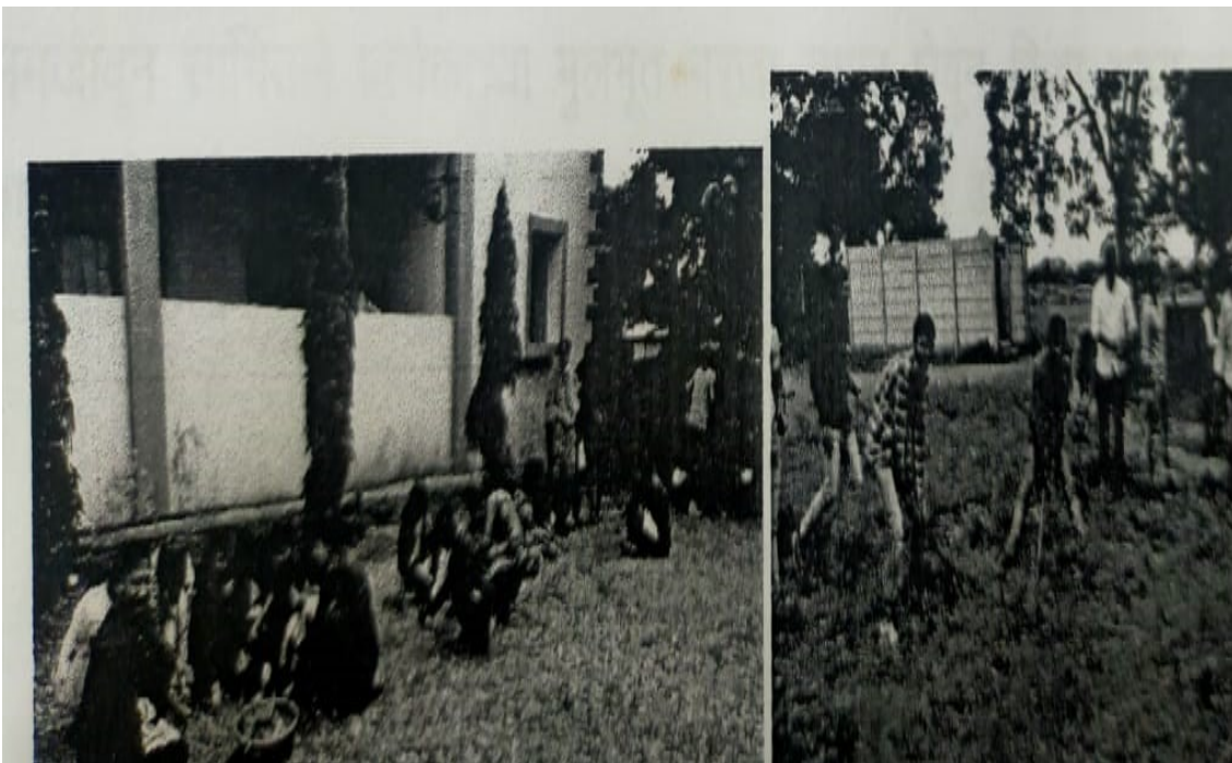
Students While Cleaning the college Campus