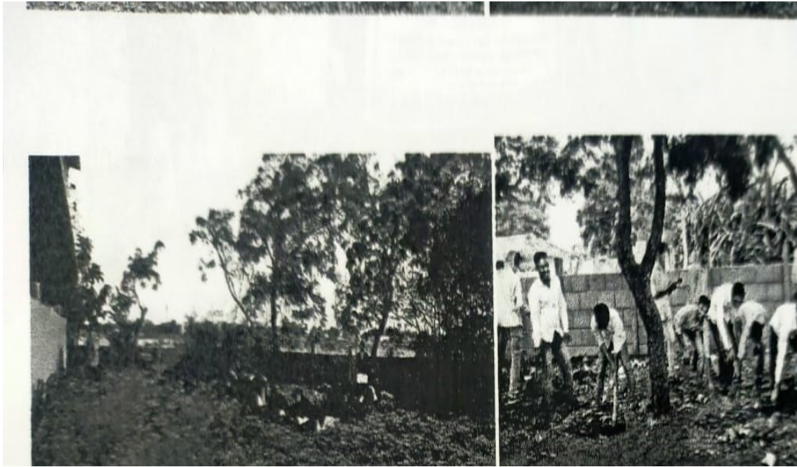
Students Clean Campus