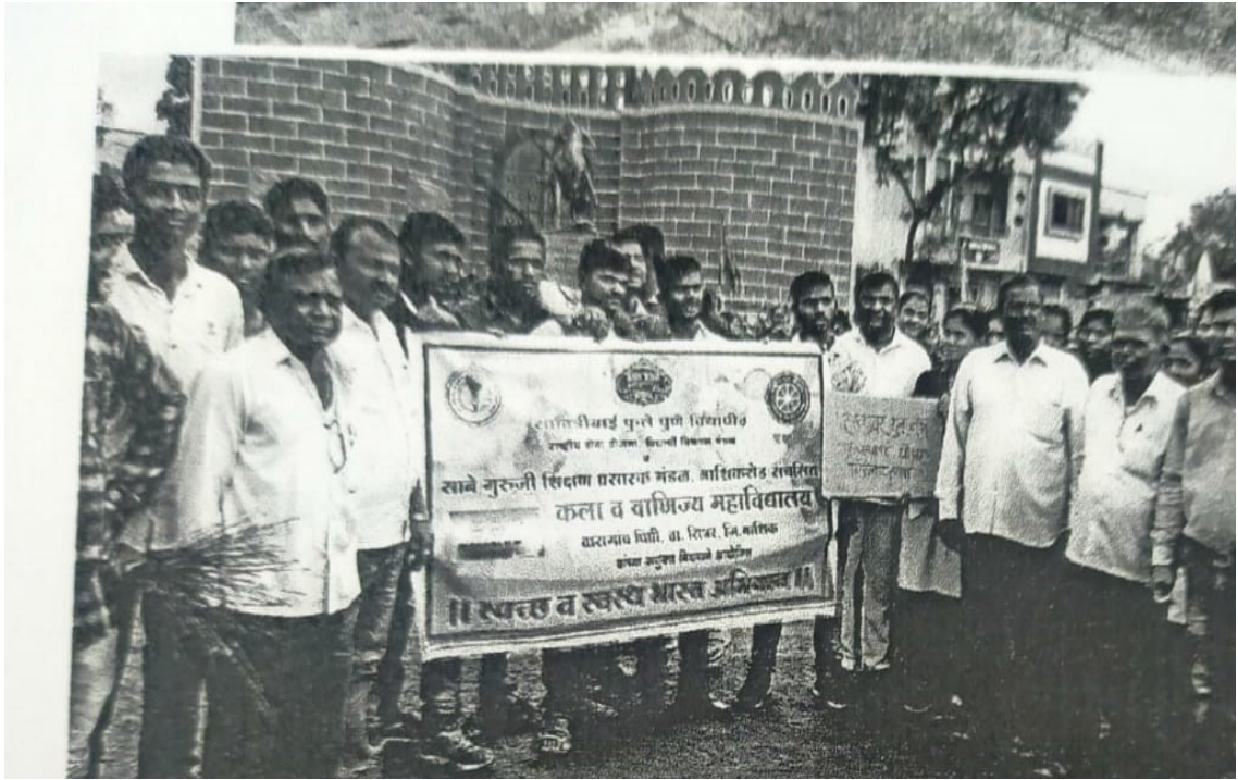
Swachh Bharat Swasth Bharat Rally in Baragaon Pimpri Village