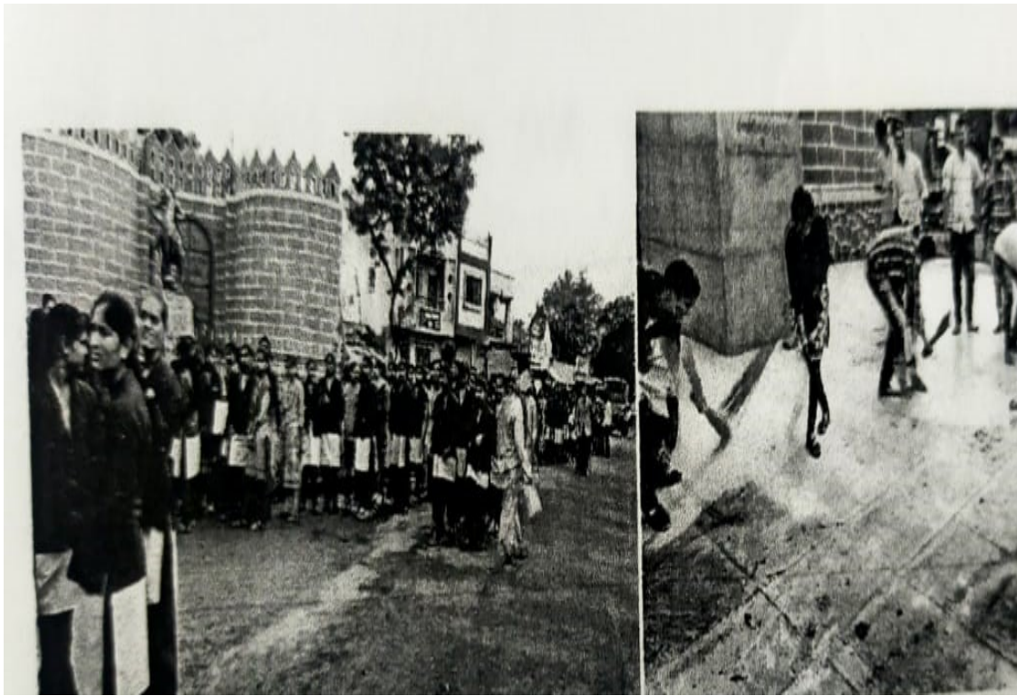
Students Clean the Shivaji Maharaj Smarak