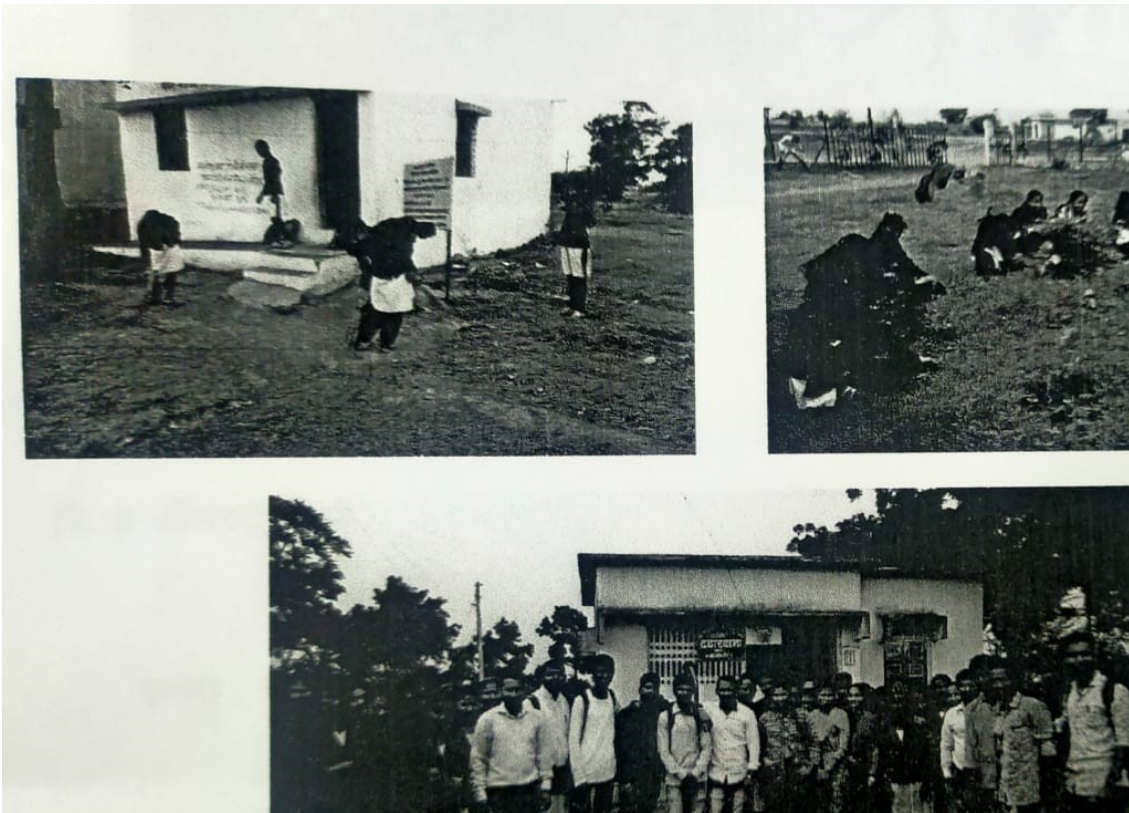
Students Clean the Animal husbandry (Hospital) & Anganwadi campus