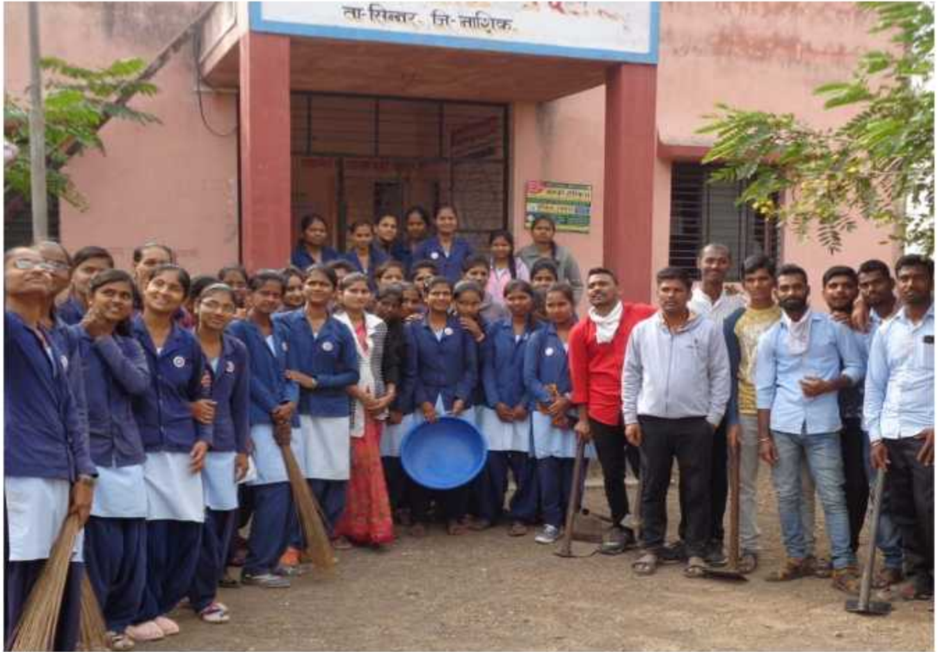
NSS Students clean the village