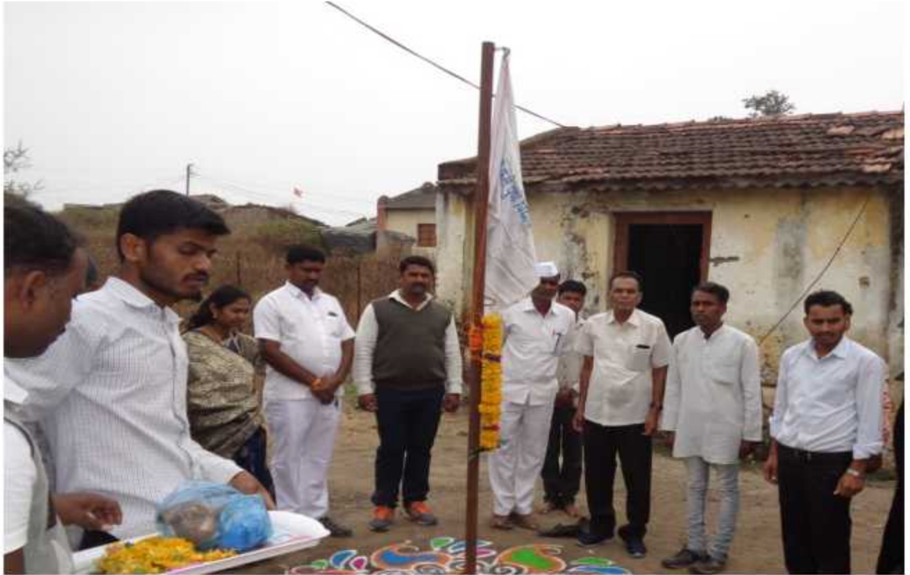
NSS Flag hoisting