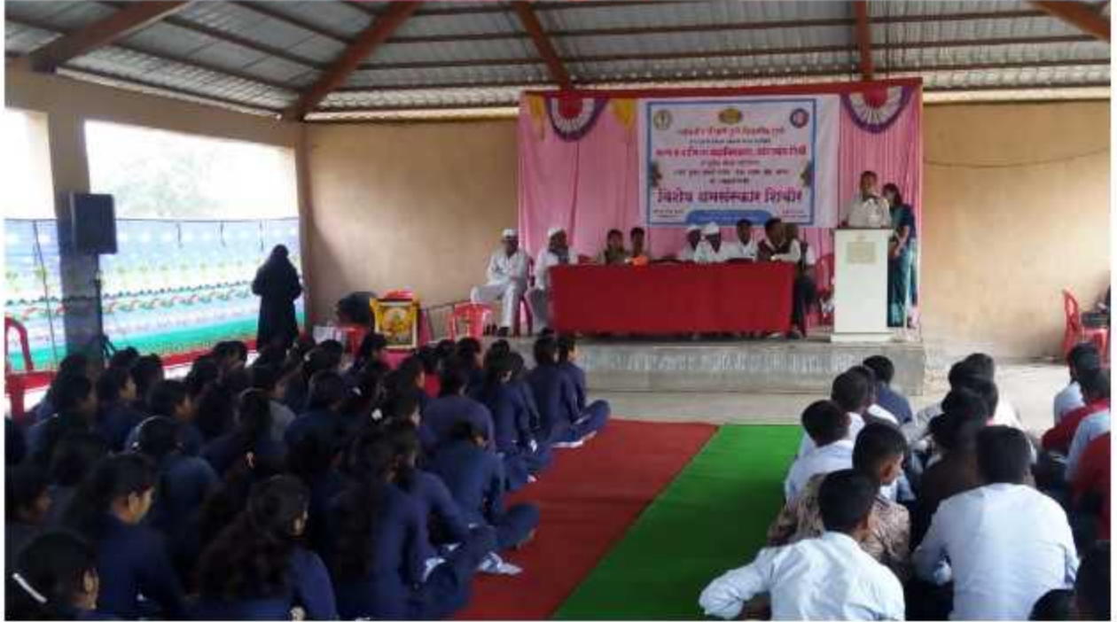
NSS Camp Inauguration Ceremony Programme