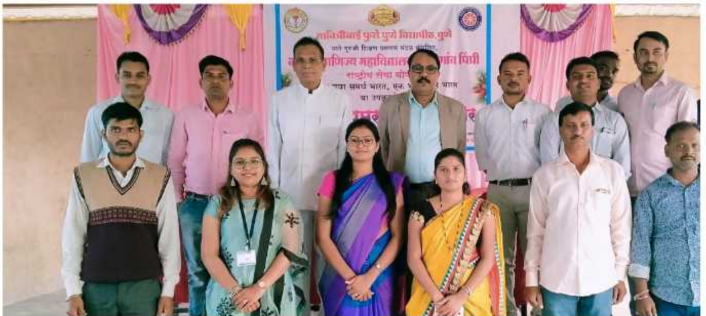
NSS Camp Closing Ceremony Programme