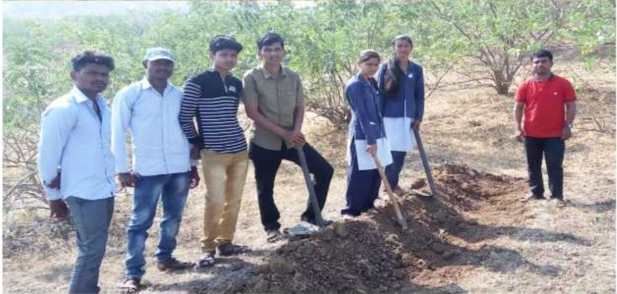
NSS Student Create Soak Pit at Deshwandi Village