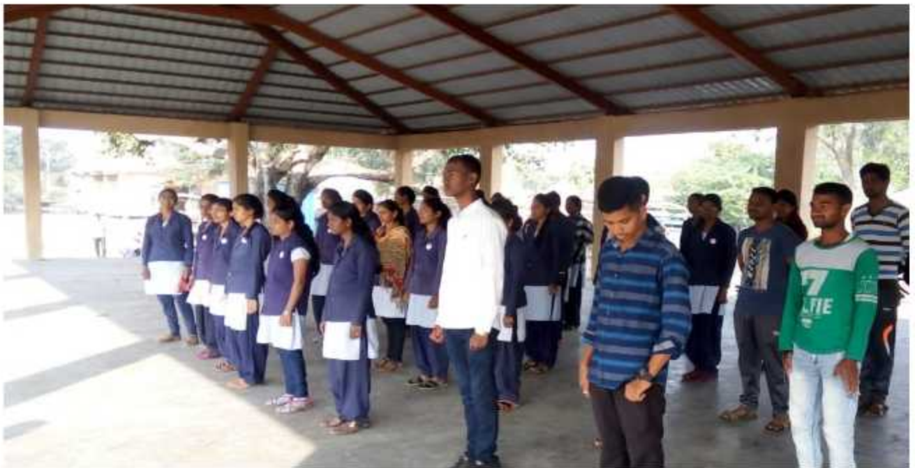
NSS Students Assembly