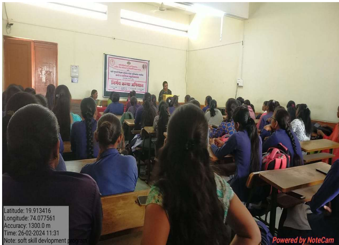
Dr. adik madam guide to students(girls) about ladies' health