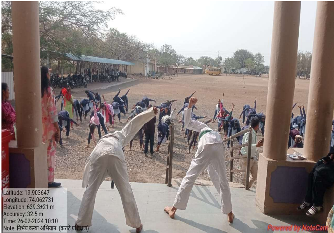
“ Nirbhay kanya abhiyan” introduction of guest

Latitude: 19.903647 Longitude: 74.062731 Elevation: 639.3±21 m Accuracy: 32.5 m Time: 26-02-2024 10:10 Note: निर्भय कन्या अभियान (कराटे प्रशिक्षण)