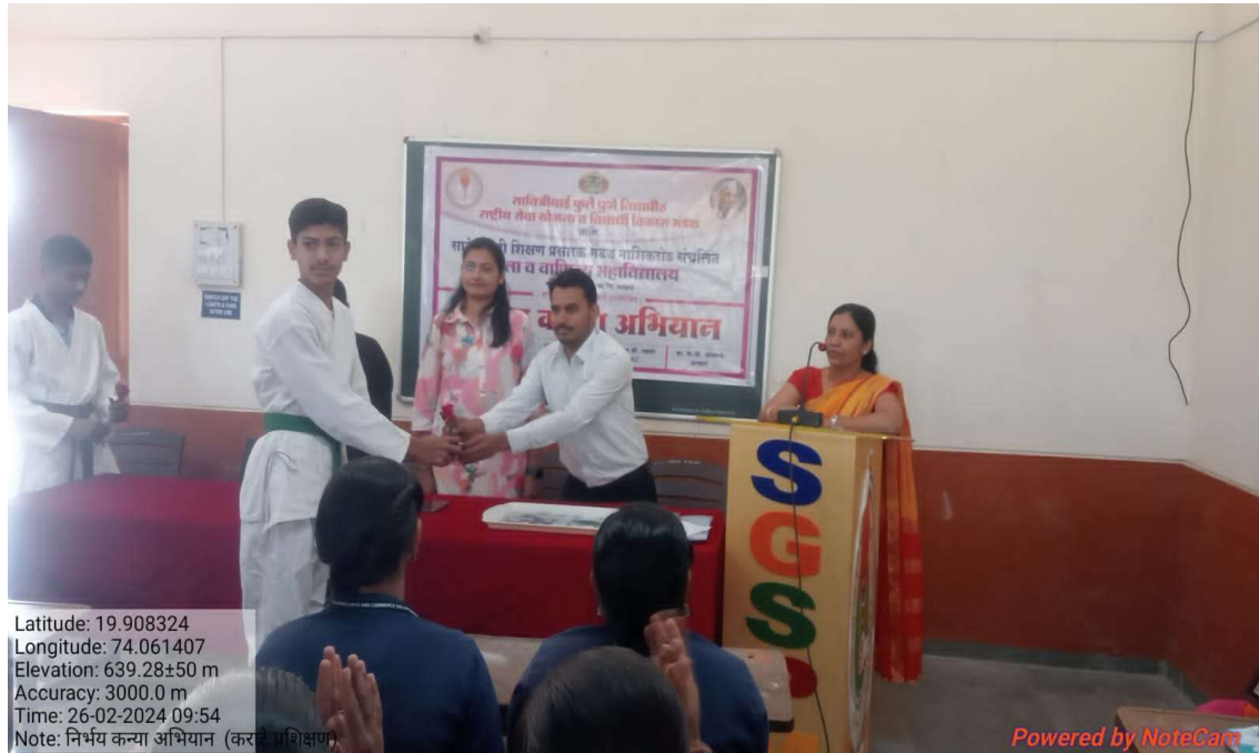
Felicitation of karate trainer by honourable principal