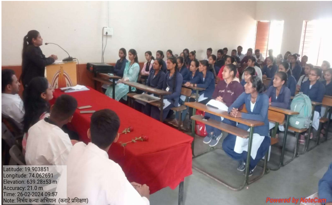
Karate trainer guide to students about karate skill