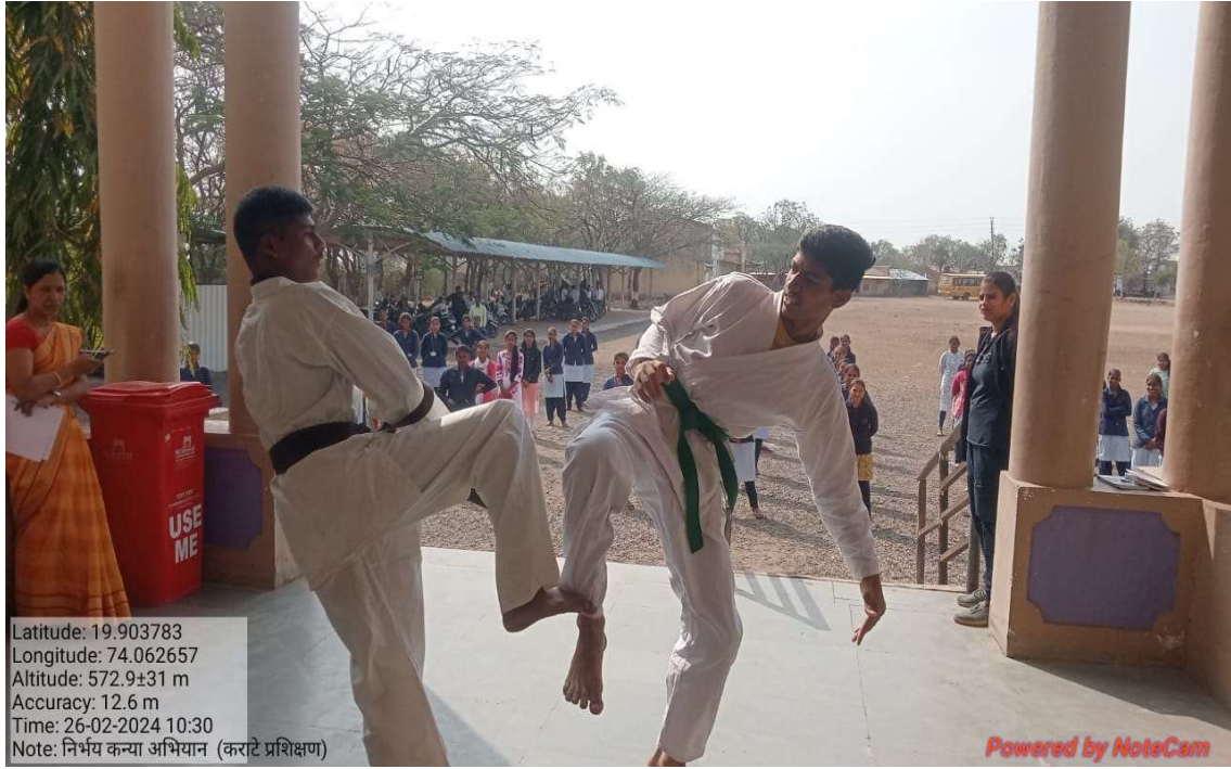
Karate trainer train to students