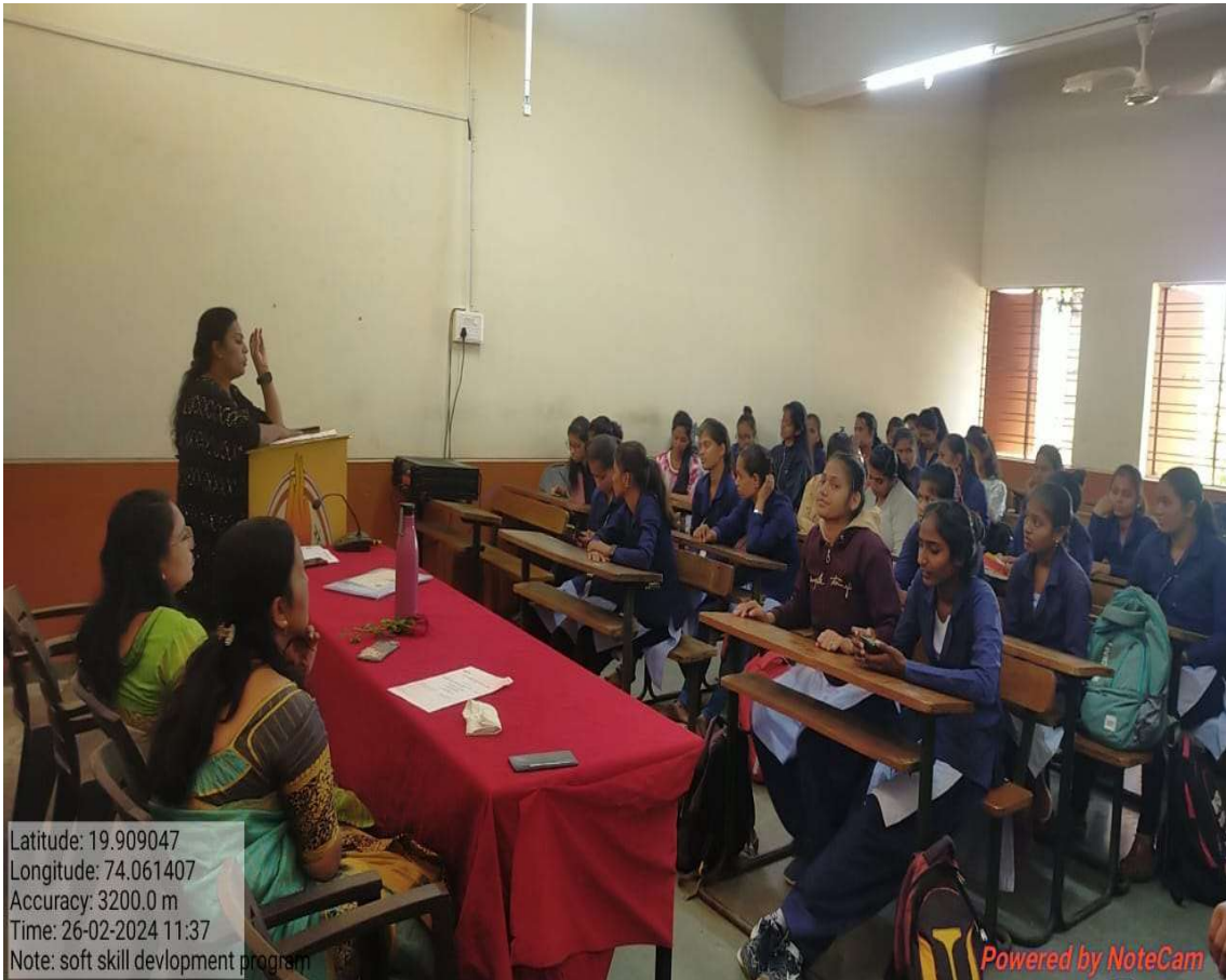
Dr. adik mam guide to student about health care