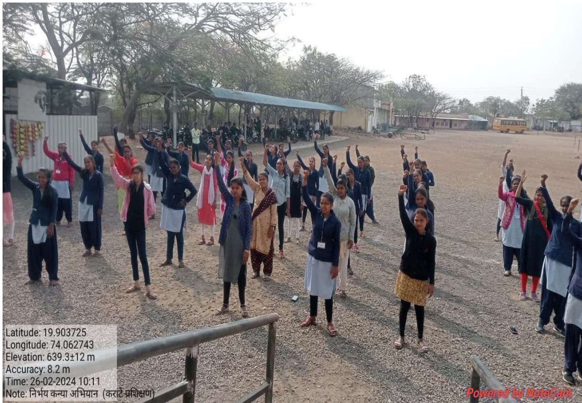
Students experment about karate