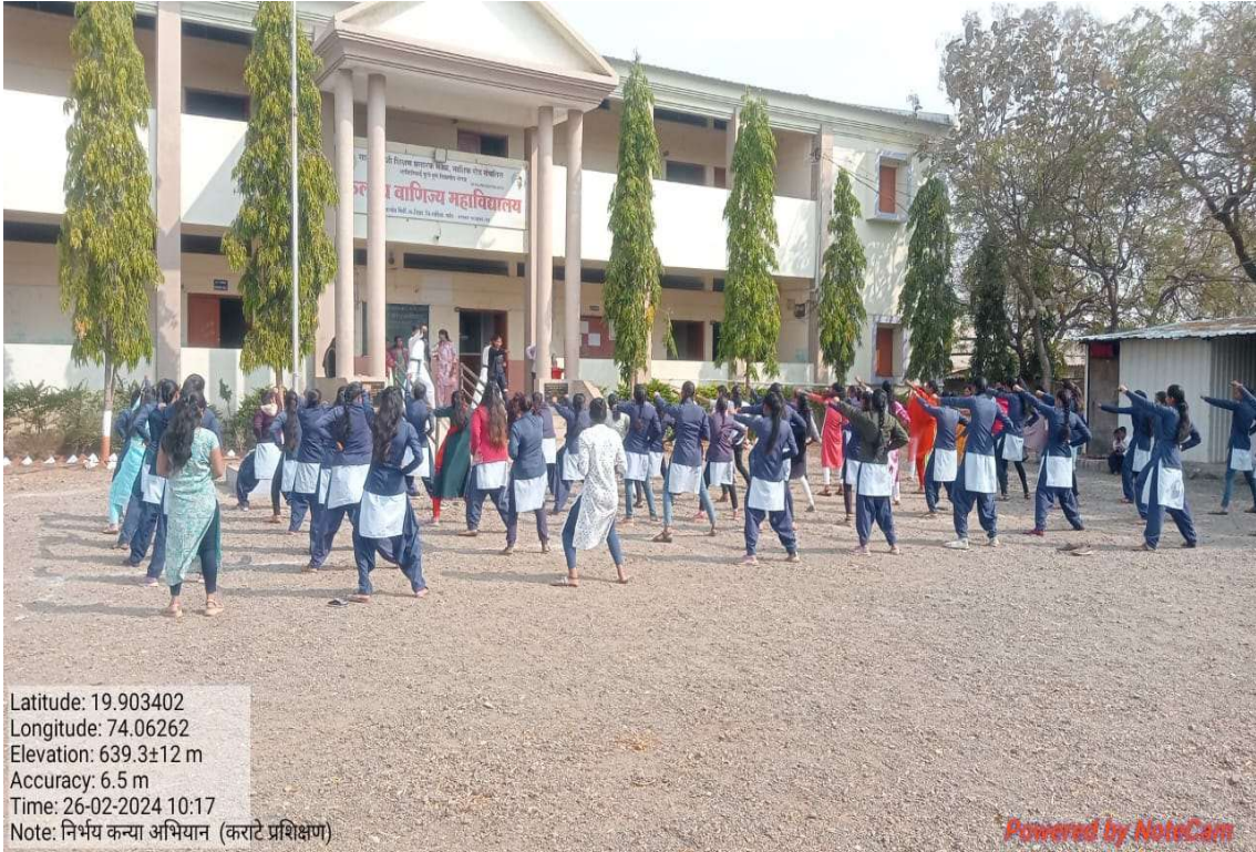
students participation In program