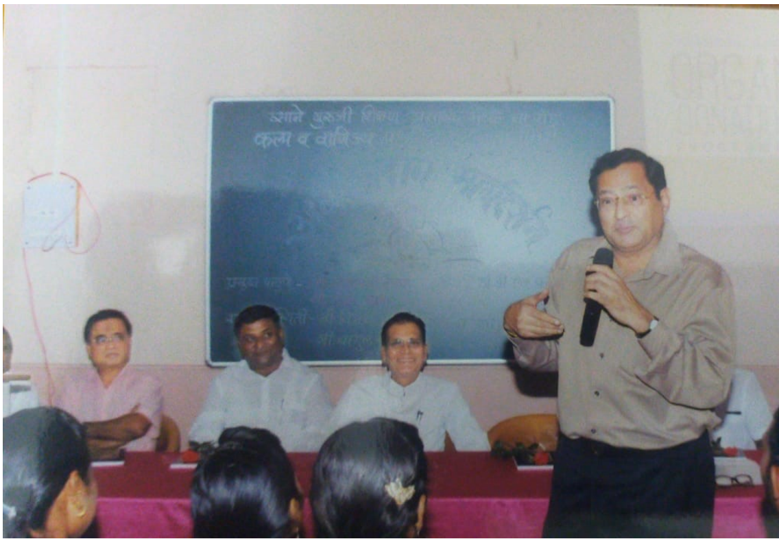
Chief guest vijay ji kela guide the student