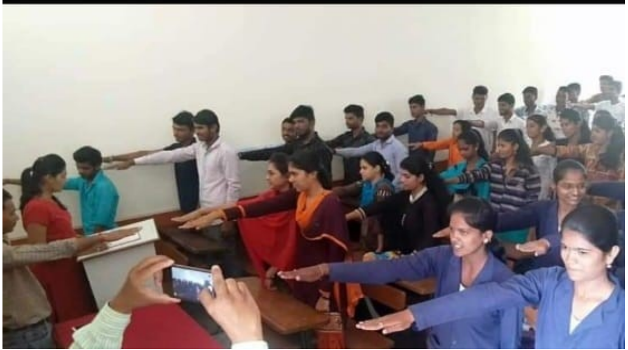
Students tobacco addiction program oath