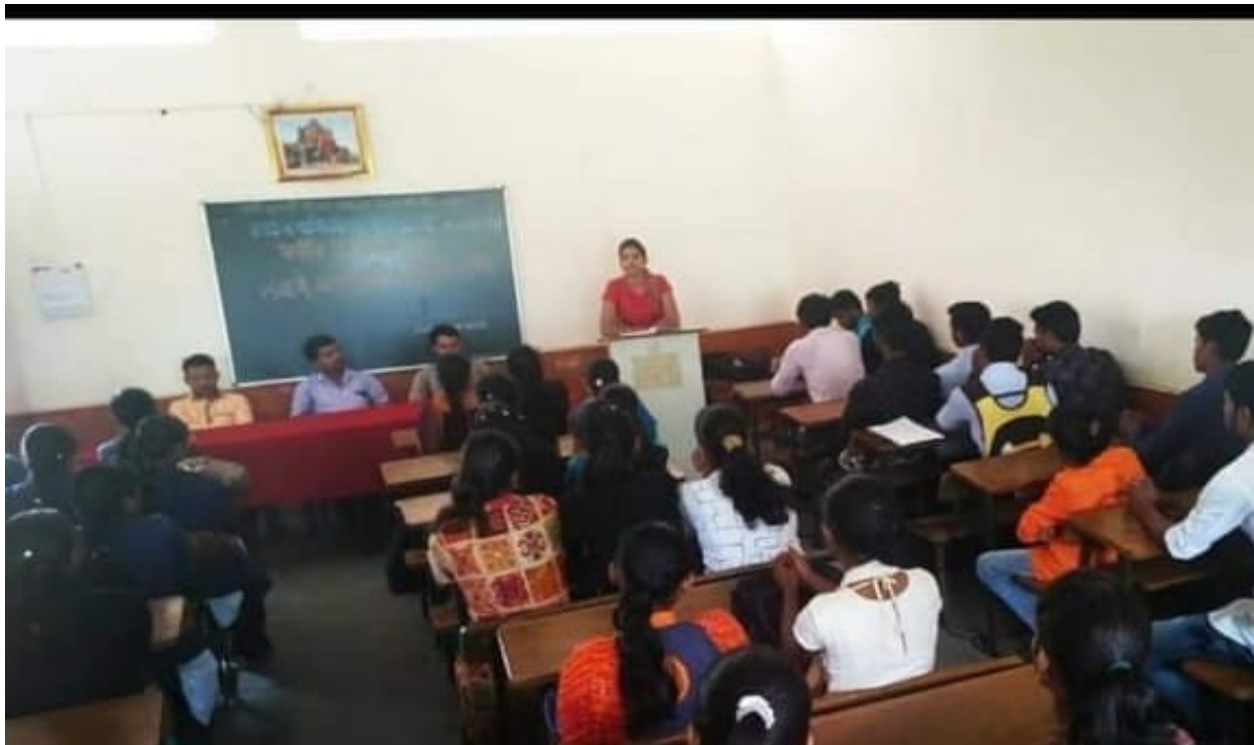
Guide to students for tobacco addiction program