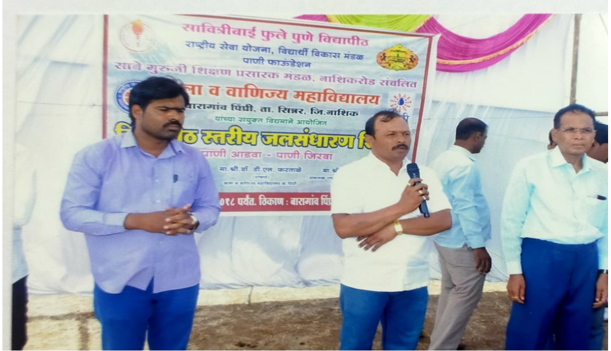
Village baragaon pimpri sarpanch communicate with Student