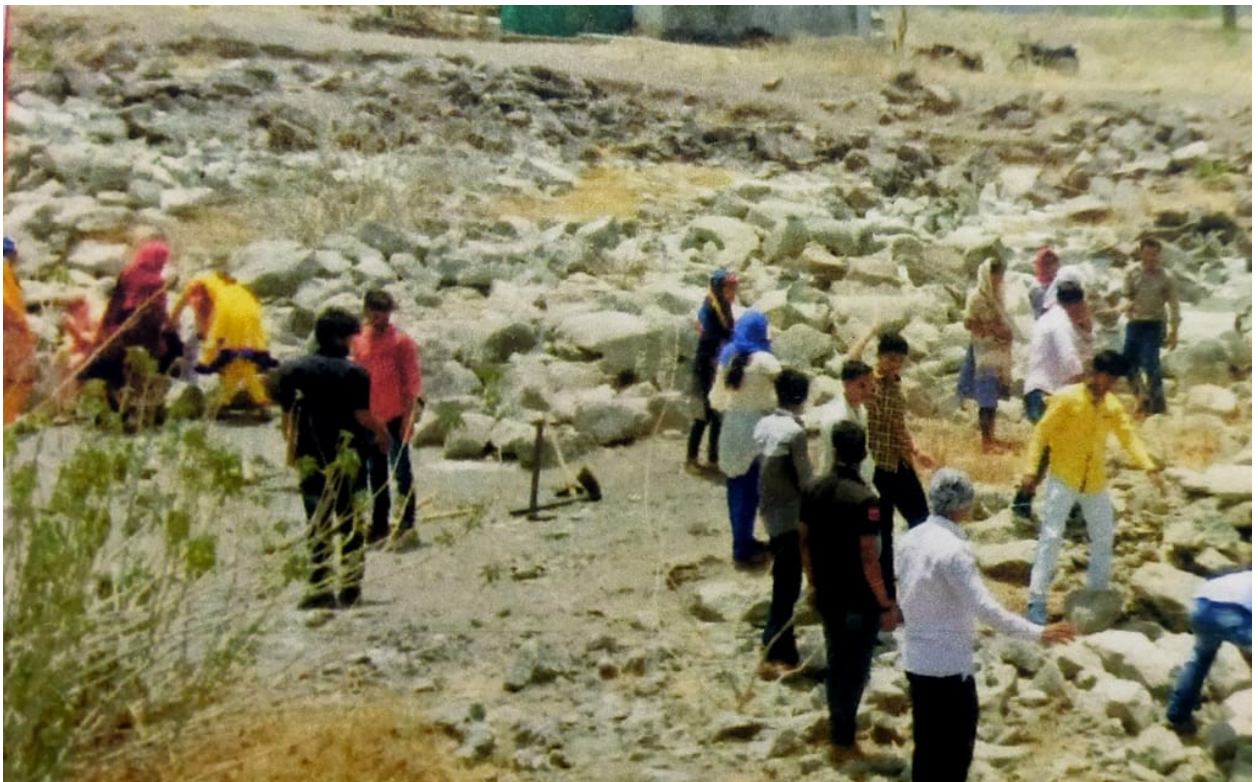
*Student sWork in river*