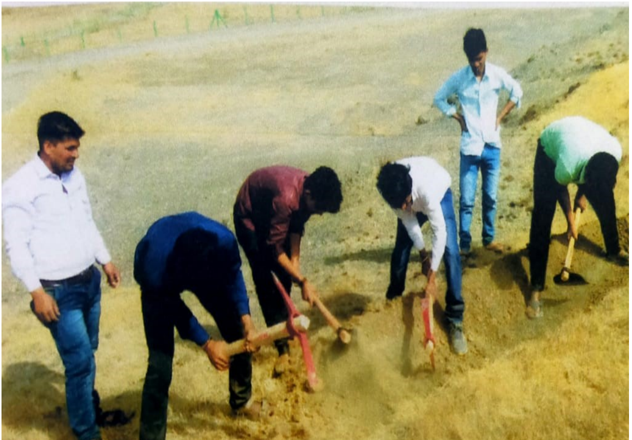
* Students work in place*