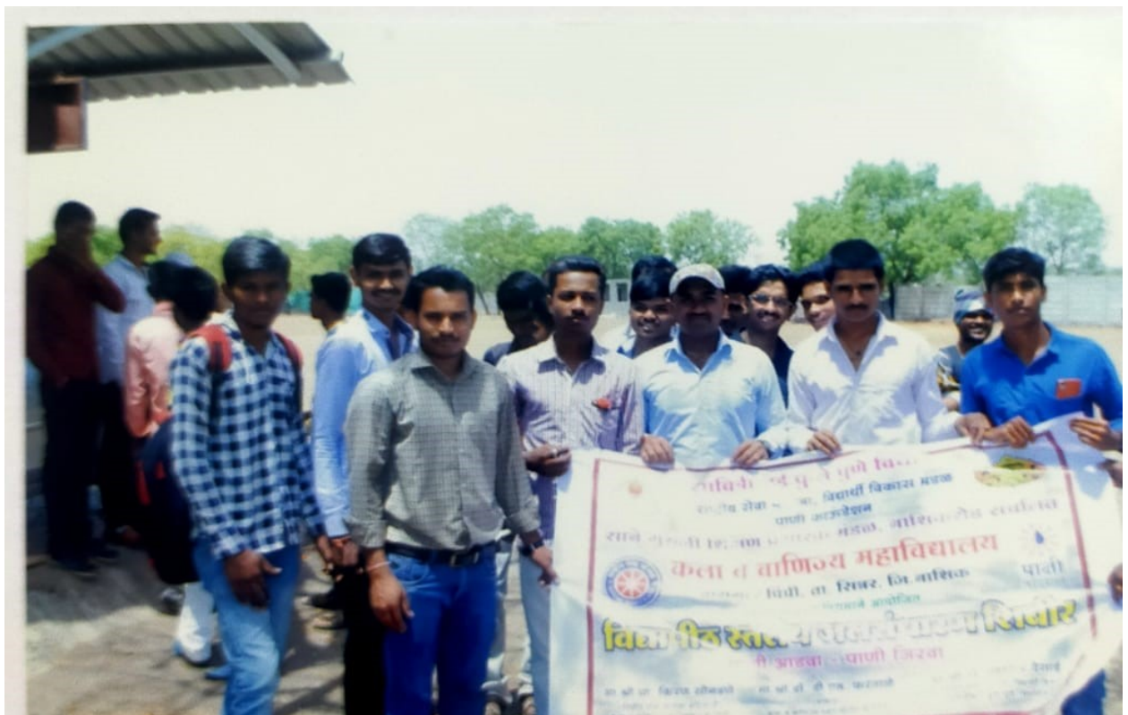
* Student With Banner *