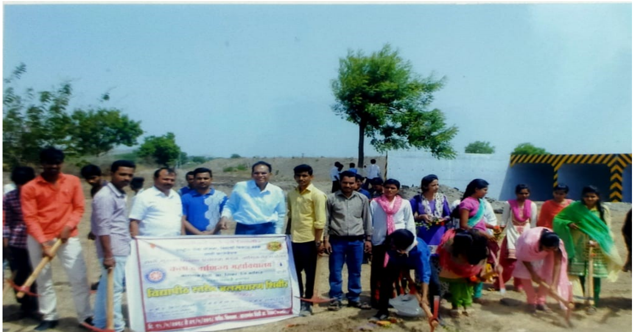
* Students @ Working Place with Staff & Principal *