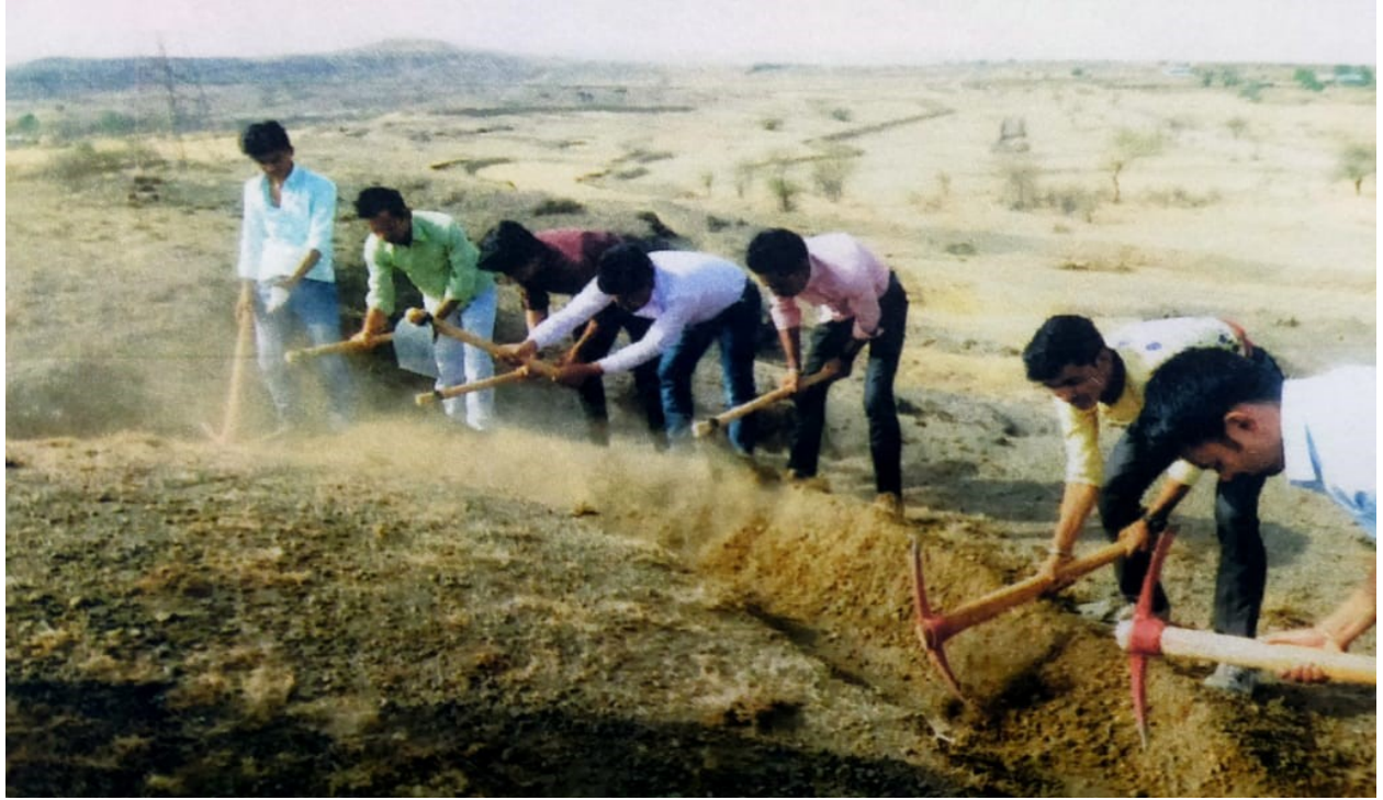
* Students work in hill Place *