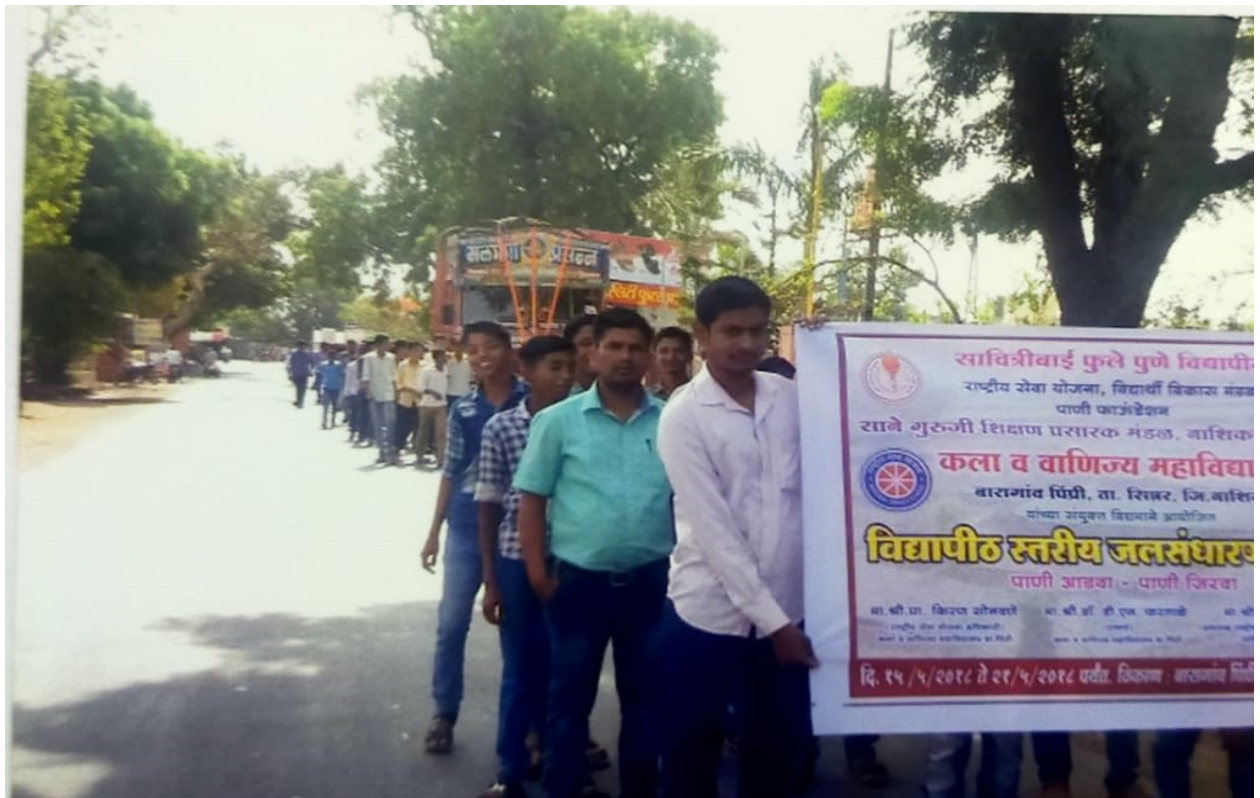
* Water conservation awareness rally in village from Students*