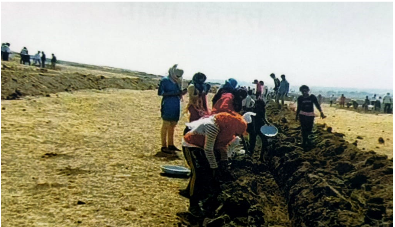
* Students work in place*