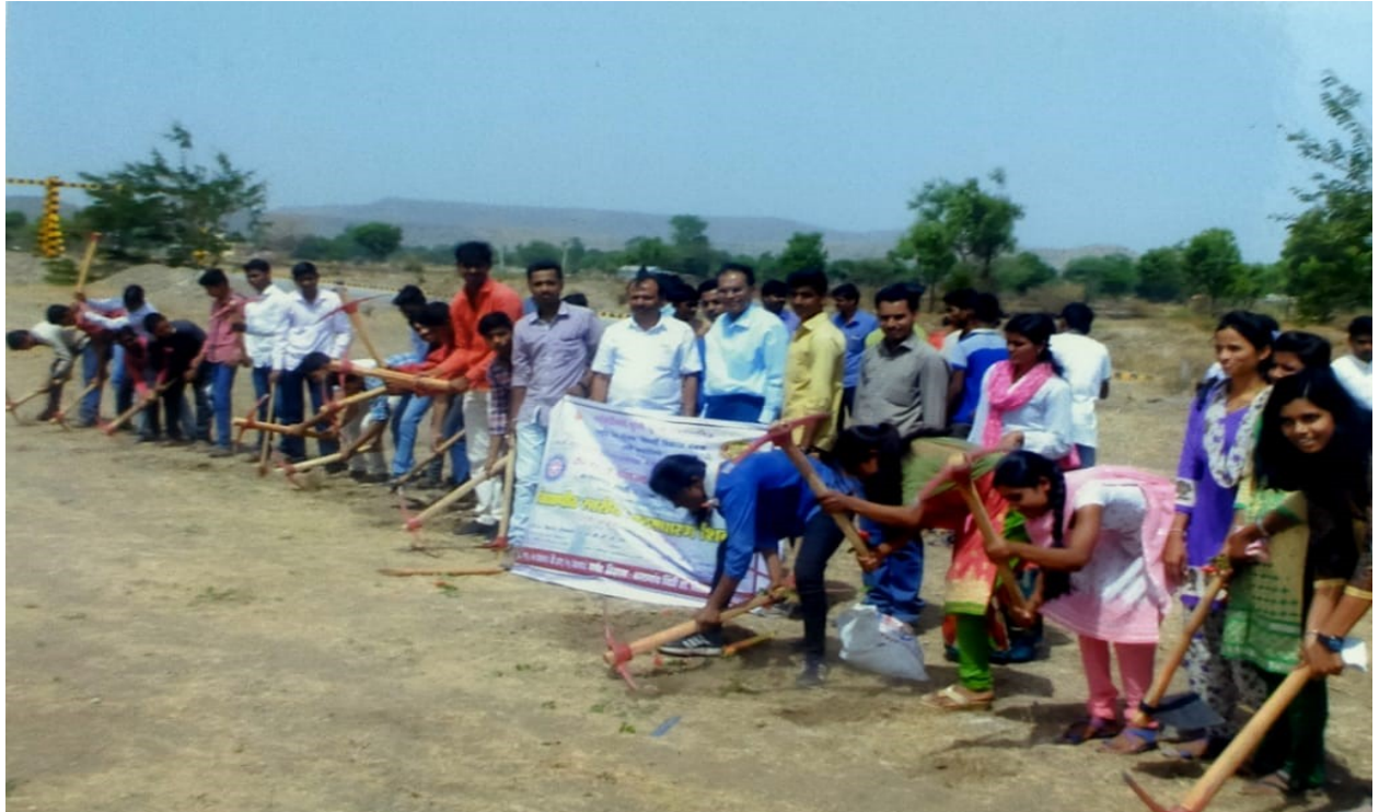
* Students ignorant water conservation program @ work place *