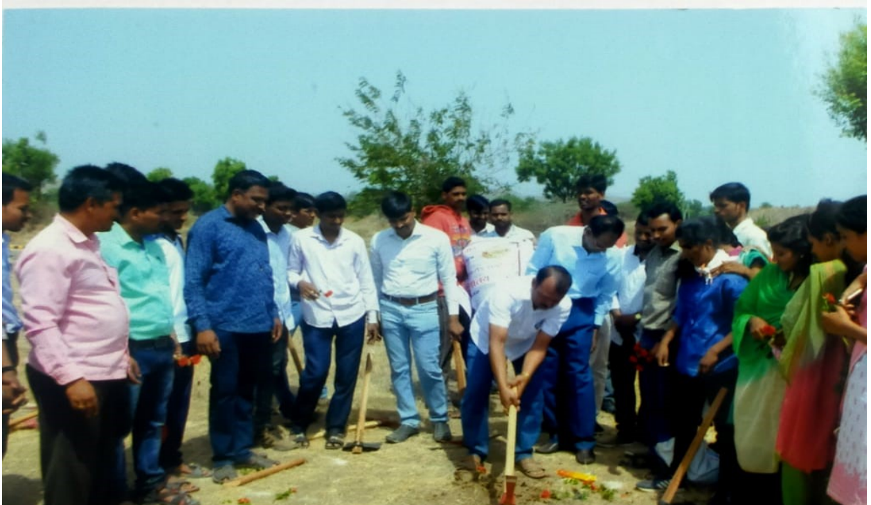
*Village baragaon pimpri Sarapancha inauguration water conservation program in village*