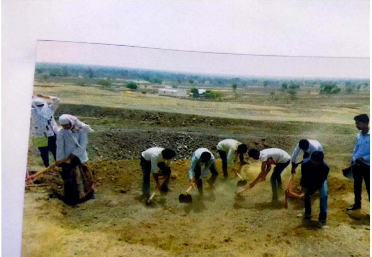
* Students Work in place *