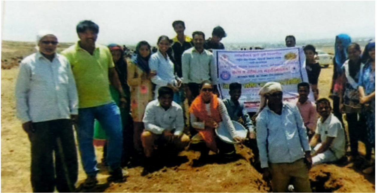
*tudents work in place*