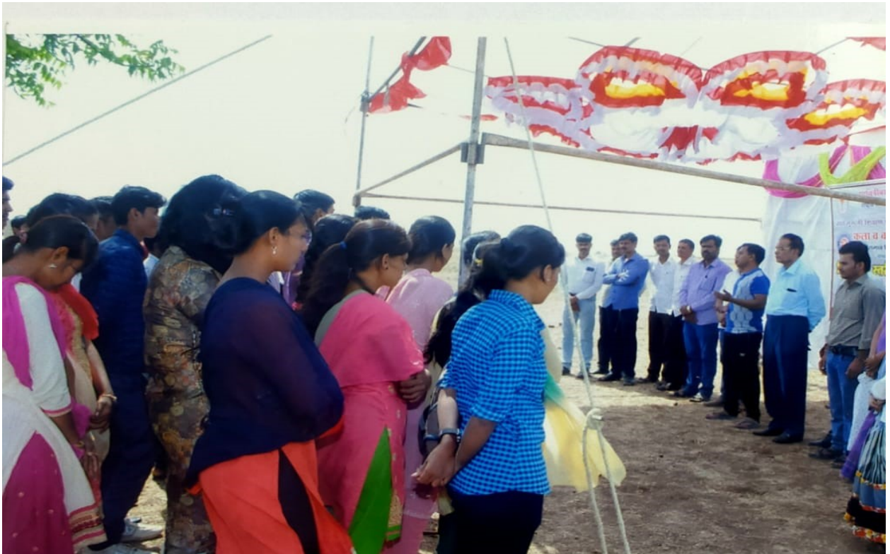
* Pani foundation chief guest communicate with Students*