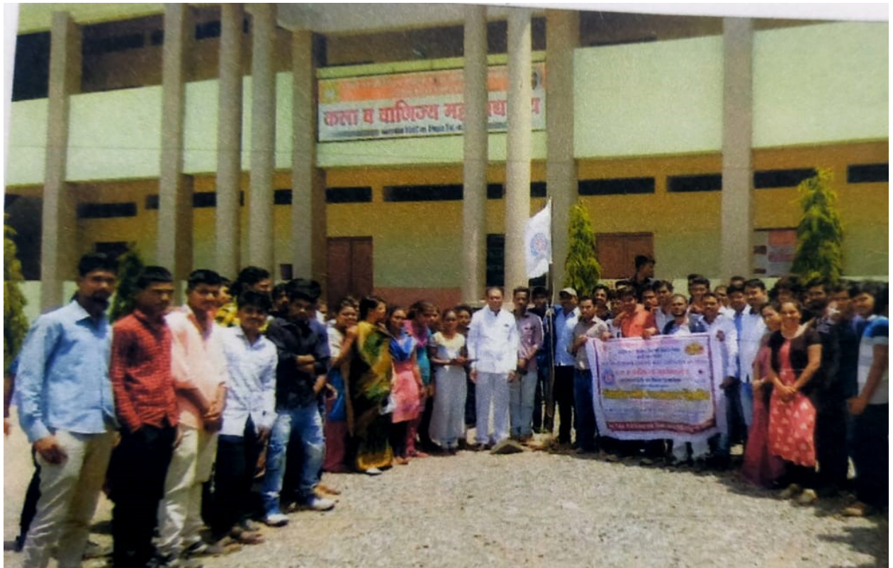
*College Campus Students With banner*