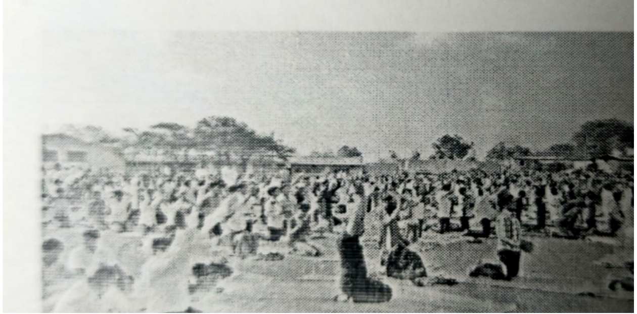
Students performance of international yoga day (21/06/2019)