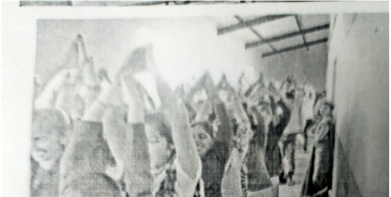
Students activity on international yoga day