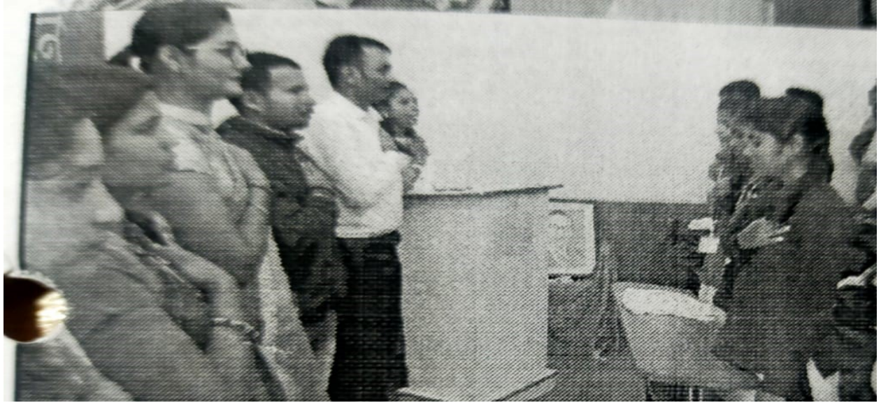
Constitution oath program