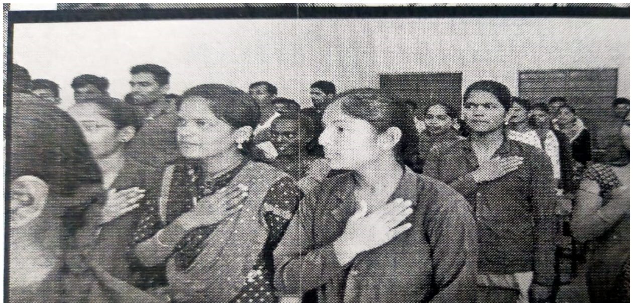
Students oath in Indian constitution program