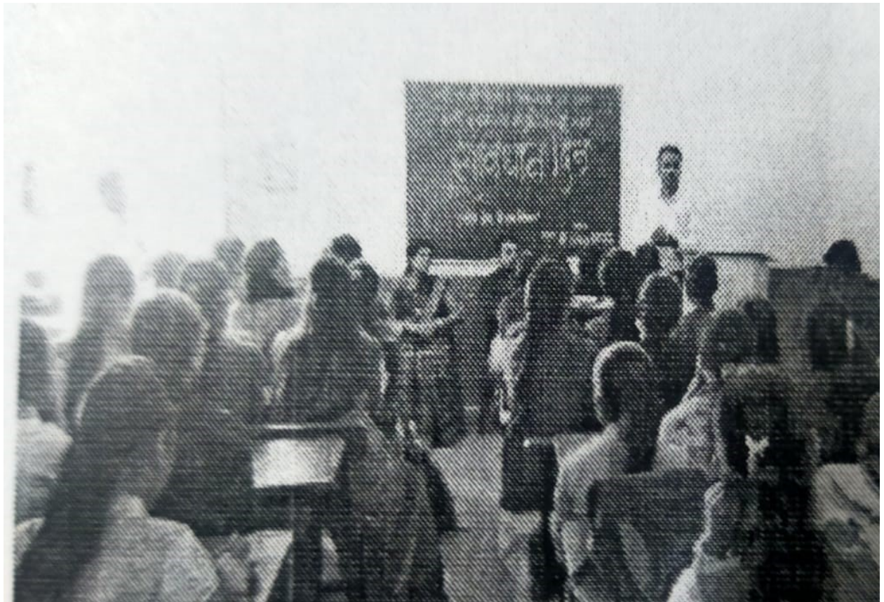
Indian constitution day celebration